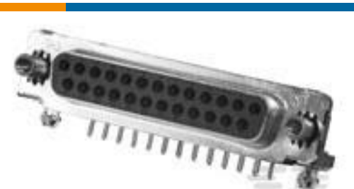
TE 产品编号5745784-4 37 MSFL RCPT RA 318 (IN,FM)