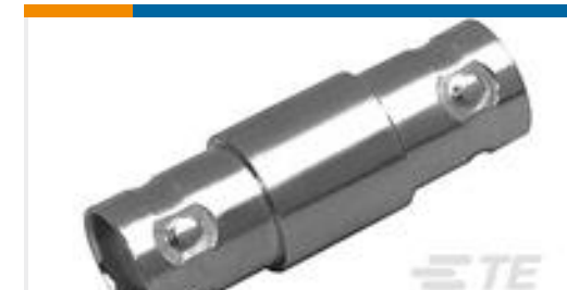
TE 产品编号221551-3 FEEDTHRU,JACK,BNC,REPACKAGE