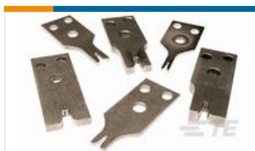
TE 产品编号1-1633961-4 CRIMPER, INSULATION F PREMIUM