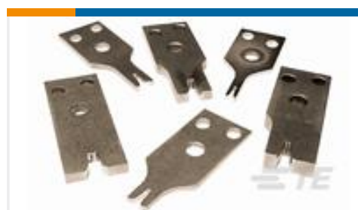
TE 产品编号3-1633609-8 CRIMPER, WIRE "F" (.046")