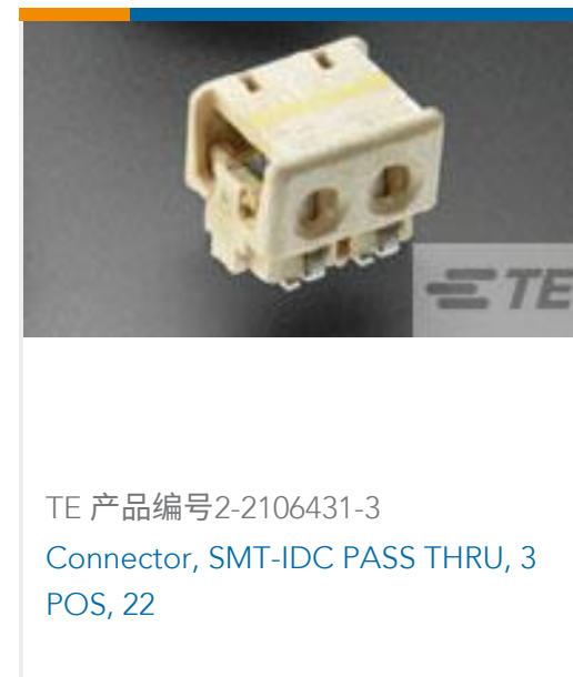
TE 产品编号2-2106431-3 Connector, SMT-IDC PASS THRU, 3 POS, 22