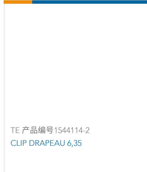
TE 产品编号1544114-2 CLIP DRAPEAU 6,35