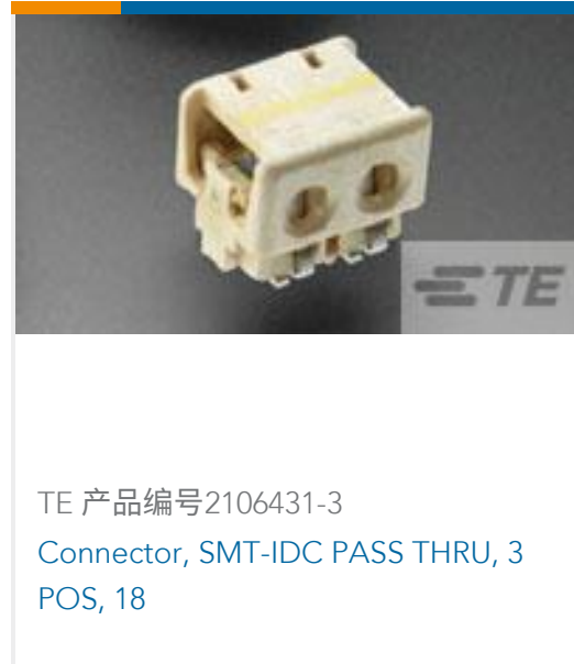
TE 产品编号2106431-3 Connector, SMT-IDC PASS THRU, 3 POS, 18