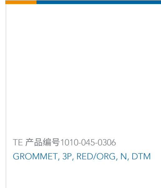
TE 产品编号1010-045-0306 GROMMET, 3P, RED/ORG, N, DTM