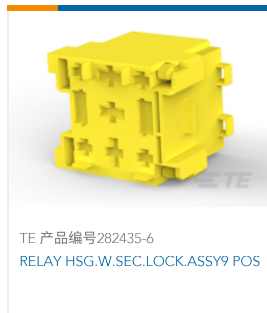
TE 产品编号282435-6 RELAY HSG.W.SEC.LOCK.ASSY9 POS