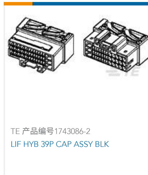
TE 产品编号1743086-2 LIF HYB 39P CAP ASSY BLK