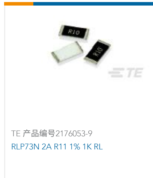
TE 产品编号2176053-9 RLP73N 2A R11 1% 1K RL