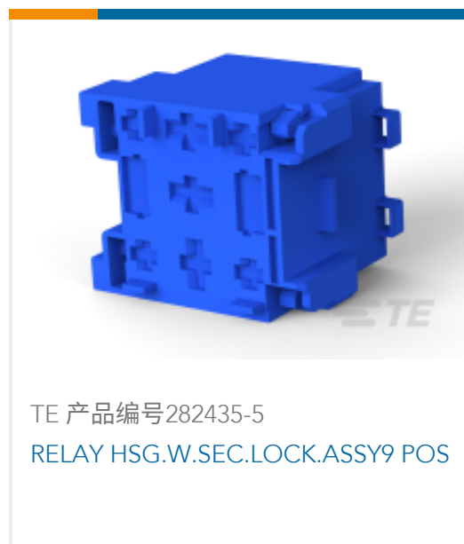
TE 产品编号282435-5 RELAY HSG.W.SEC.LOCK.ASSY9 POS