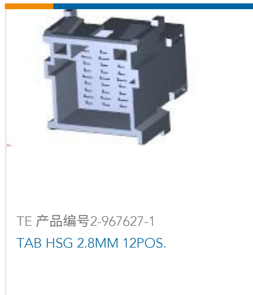
TE 产品编号2-967627-1 TAB HSG 2.8MM 12POS.