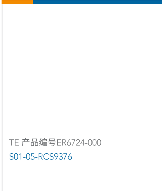
TE 产品编号ER6724-000 S01-05-RCS9376