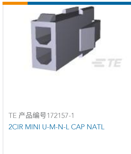
TE 产品编号172157-1 2 CIR MINI U-M-N-L CAP NATL