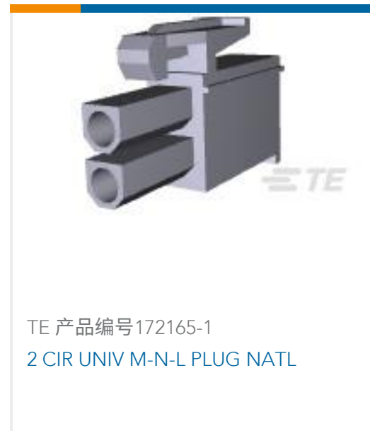
TE 产品编号172165-1 2 CIR UNIV M-N-L PLUG NATL