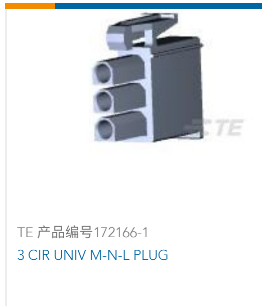
TE 产品编号172166-1 3 CIR UNIV M-N-L PLUG