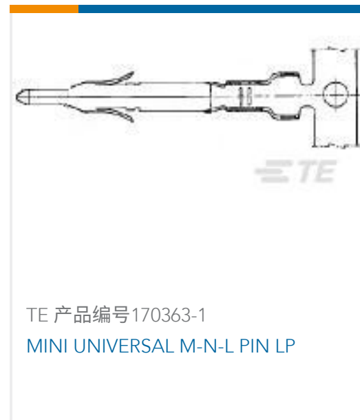
TE 产品编号170363-1 MINI UNIVERSAL M-N-L PIN LP