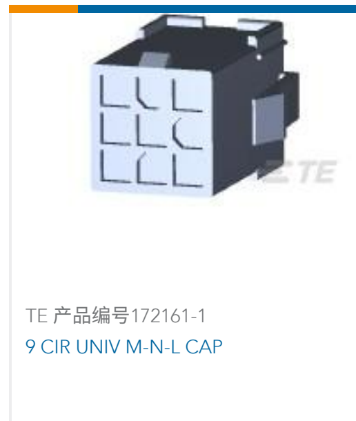
TE 产品编号172161-1 9 CIR UNIV M-N-L CAP