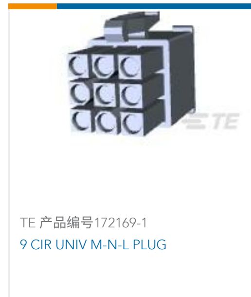
TE 产品编号172169-1 9 CIR UNIV M-N-L PLUG