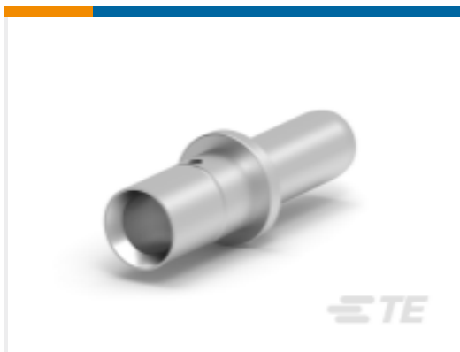
TE 产品编号SRK-PC-080-25-601 PIN, SOLID, SIZE M8, 25mm2, AG