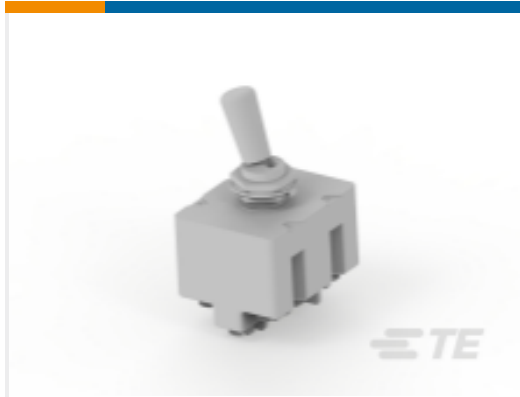
TE 产品编号K1002956 Toggle Switch 08-4-1-13