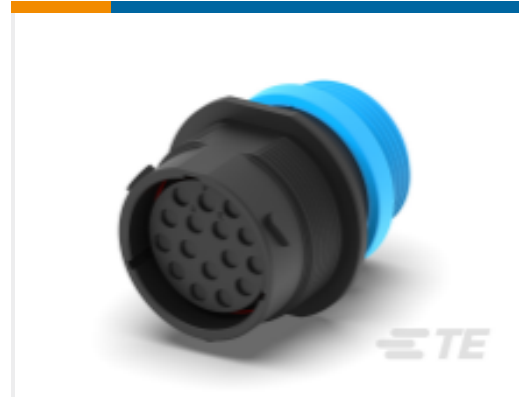
TE 产品编号HDP24-24-16SE-L015 REC, 16P, BLK, E, THD, 12, S