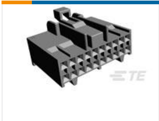
TE 产品编号172047-2 DLI HSG 20 POS MOD IV TYPE