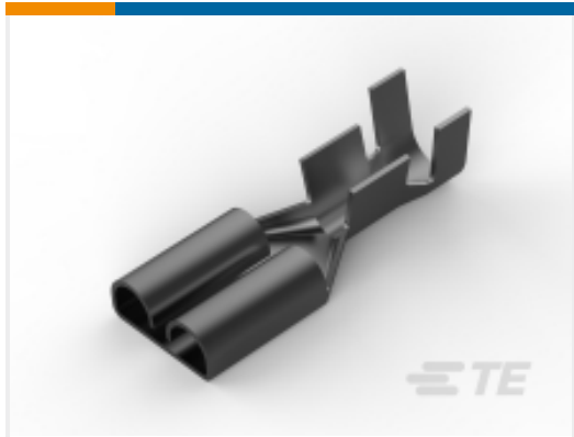
TE 产品编号 170258-2 FF 250 REC 14-12AWG TPBR REREELING