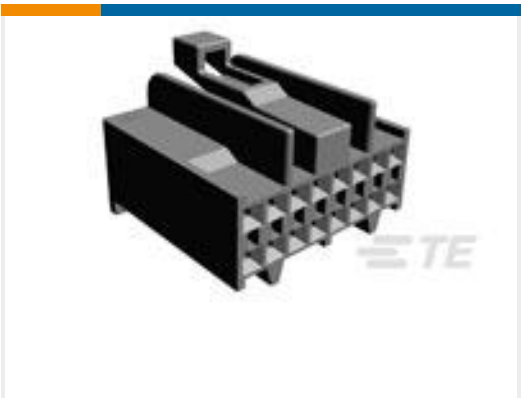
TE 产品编号172021-2 16 POS RCPT. HSG.