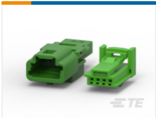
TE 产品编号 1473651-1 TH/.025 连接器系统, 壳体