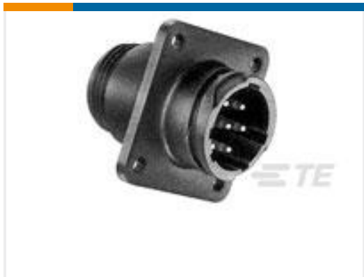
TE 产品编号213870-1 23-19 RCPT HSG,STD SEX,CPC