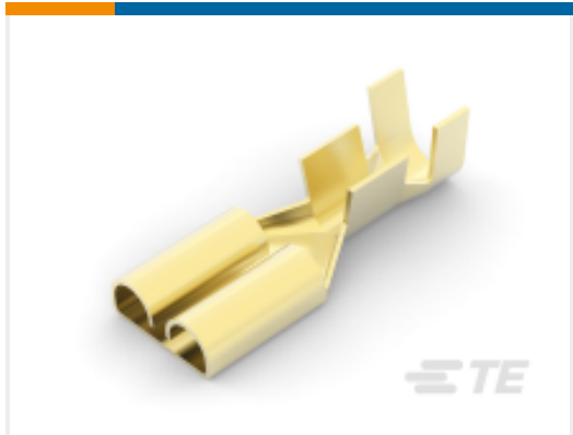
TE 产品编号 170258-1 FF 250 REC 14-12AWG BR REREELING