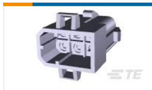
TE 产品编号171383-1 6 CIRCUIT M-N-L CAP