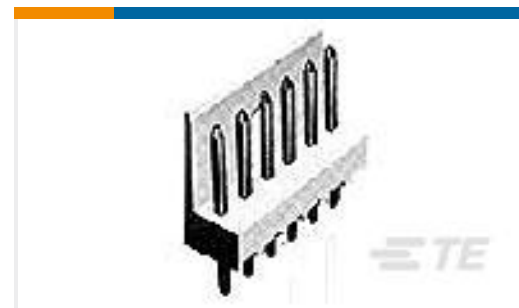
TE 产品编号1-171825-2 POST HDR ASSY VERT AMP EI CONN