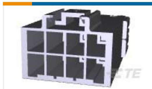
TE 产品编号179467-1 AMP POWER DBL LOCK CAP HSG 8P