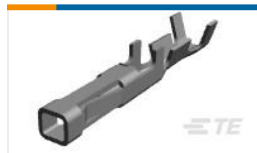
TE 产品编号794607-1 MICRO MNL RPT CNT STRIP 26-30