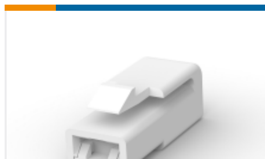
TE 产品编号176986-1 FF 250 PLUG HSG 1P NYLON NAT