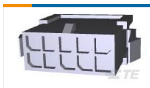
TE 产品编号1-794615-0 PANEL MT DBL ROW HSG 10 POS