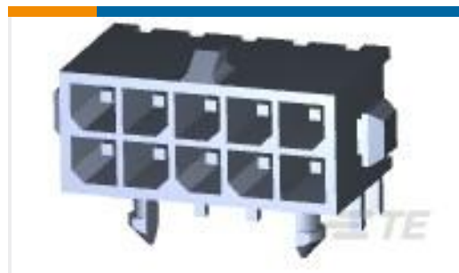
TE 产品编号4-794618-0 10P MICRO MNL ASSY R/A HDR LF