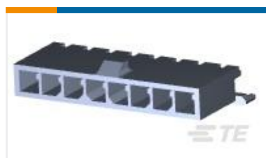
TE 产品编号2-1445050-8 MICRO MNL HDR ASSY S/ROW LF