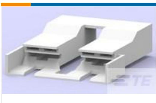
TE 产品编号1-521253-3 PL MKIII & FASTON 250 HSG 2P NYLON GREEN