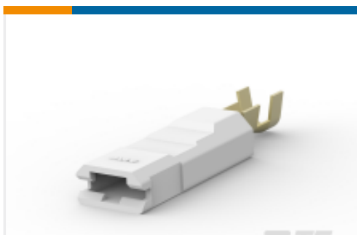
TE 产品编号1969104-1 ULTRA POD：直形，母端组件，无镀层，0.250 英寸