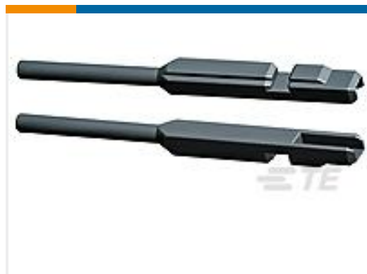
TE 产品编号1394871-1 MQS DICHTSTOPFEN