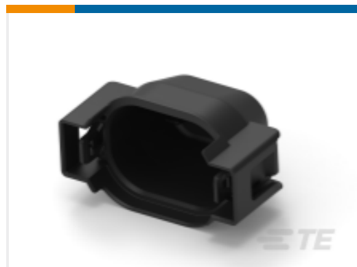
TE 产品编号1-2066502-4 COVER 2 POS MINI FUSE BOX, MAT-2