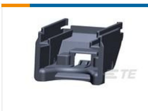
TE 产品编号2112228-1 PROTECTION CAP, TE