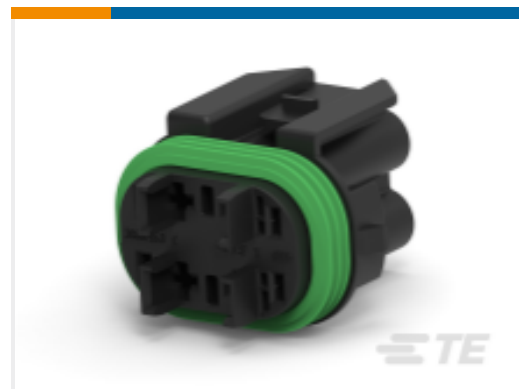
TE 产品编号2066046-3 2 POS MINI FUSE BOX ASSY