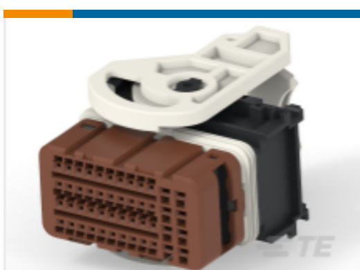
TE 产品编号9-2363287-9 48 POS MIXED REC HSG BN