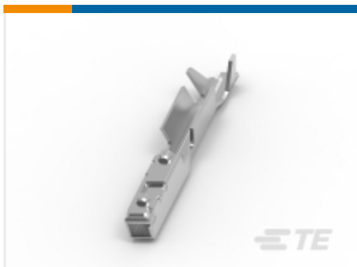
TE 产品编号1554723-1 1.0 SEALED RECEPTACLE CONTACT