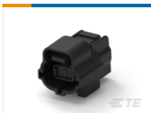
TE 产品编号2338360-1 2P ECONOSEAL RECEPTACLE ASSY