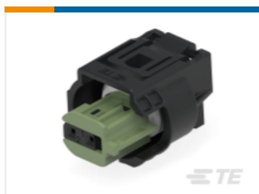
TE 产品编号2373835-1 2POS, MQS, REC HSG ASSY, SLD, COD A