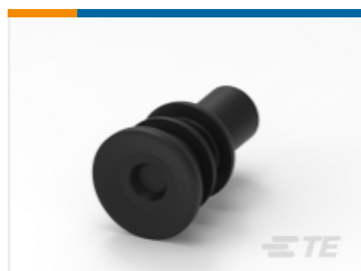
TE 产品编号2822352-2 070 TYPE RUBBER PLUG