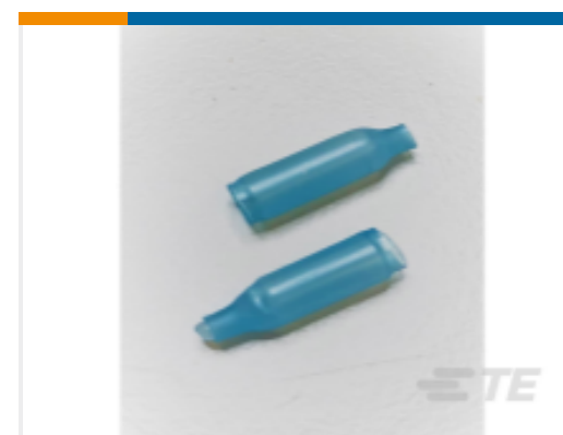
TE 产品编号 039695-000 CTA-0013