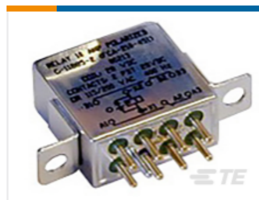
TE 产品编号 1-1617749-5 FCA-210-1020M=M83536/10-020M