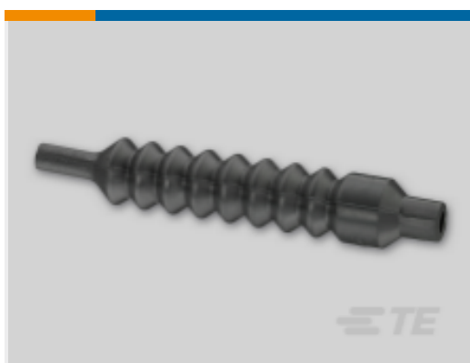
TE 产品编号 F67100-000 202C653-770-0