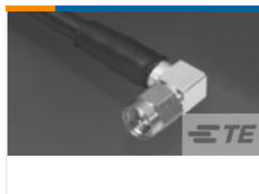
TE 产品编号 1052203-1 2037 8126 92