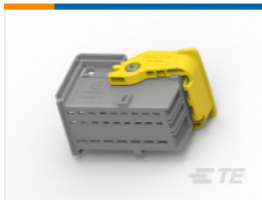
TE 产品编号1-1718484-2 AMP MCP Backshells