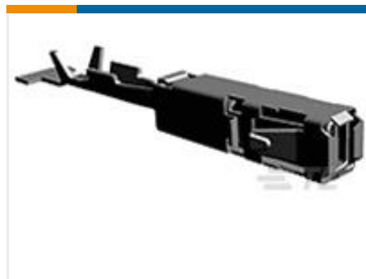
TE 产品编号1241374-1 AMP MCP 1.5K, CONTACT