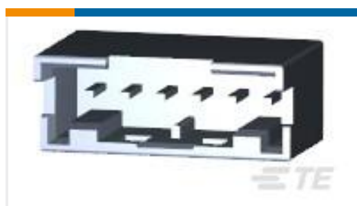
TE 产品编号1871843-6 GIC 2.5 HDR ASSY TIN VERSION 6P