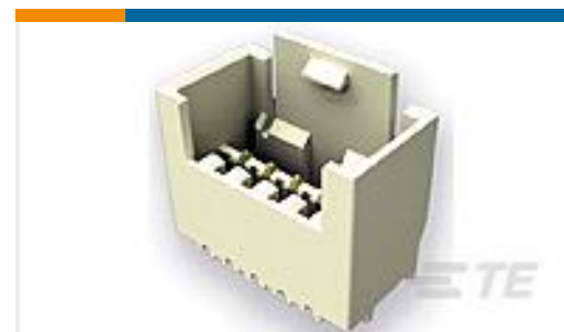
TE 产品编号1-1971922-1 6/11P,RAST 2.5 TabHeader,Ex-Locking,THV