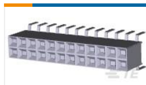
TE 产品编号5-534267-9 24 MODIV VRT DR DE 100/125