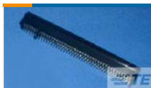
TE 产品编号3-1734774-2 PCI EXP 2.3L 64 POS BLK 15u"