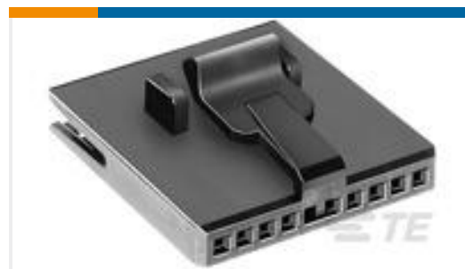
TE 产品编号3-487545-3 036 HOUSING FFC RCPT 050CL SR