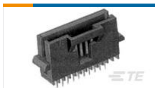
TE 产品编号1-104071-6 36 SYSTEM 50 HDR SRST SHRD