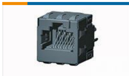
TE 产品编号2201061-1 RJ45 MODULAR JACK ASSY V 8P