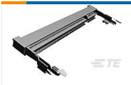
TE 产品编号1827341-4 DDR SODIMM SOCKET 200P 8H STD TYPE