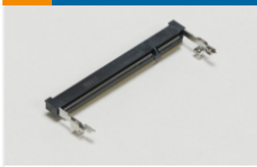
SO DIMM 插槽(7)