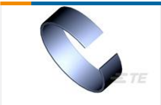
TE 产品编号745508-1 FERRULE SPLIT RING, HD