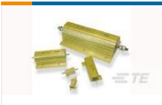
TE 产品编号1625971-7 HSA25 120R 5%