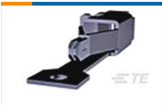
TE 产品编号1-368298-2 MINI FUSE REC(BOX TYPE)