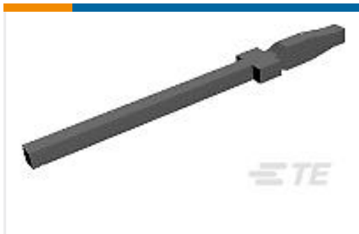
TE 产品编号8-963964-4 ACTION PIN FOR 1 mm HOLE