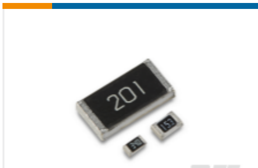
TE 产品编号3-2176328-2 CRGP 1206 3K9 1%