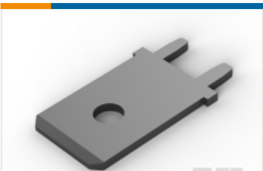
TE 产品编号1742702-3 FASTON 312 PCB TAB AGSNBR