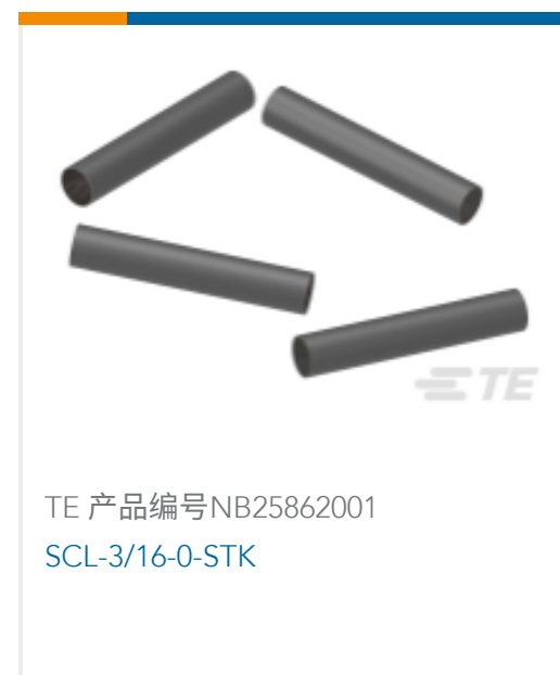
TE 产品编号 NB25862001 SCL-3/16-0-STK