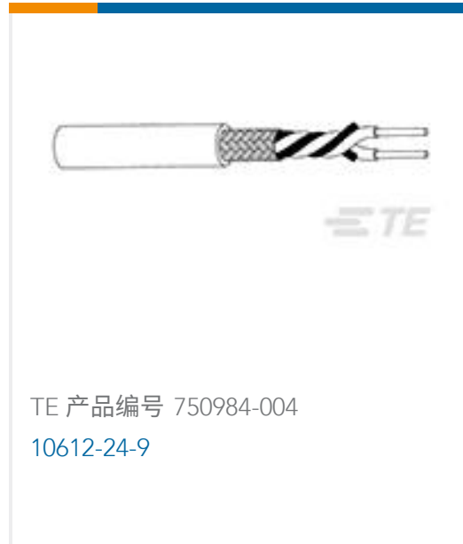
TE 产品编号 750984-004 10612-24-9