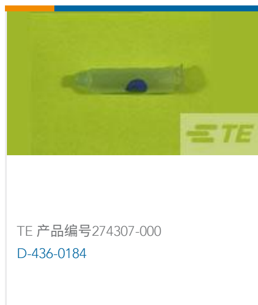
TE 产品编号 274307-000 D-436-0184