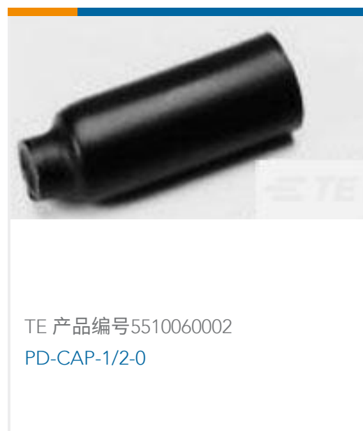
TE 产品编号 5510060002 PD-CAP-1/2-0