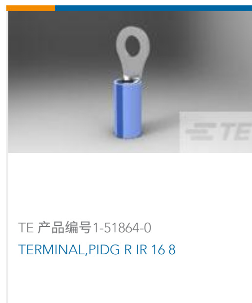
TE 产品编号 1-51864-0 TERMINAL, PIDG R IR 16 8