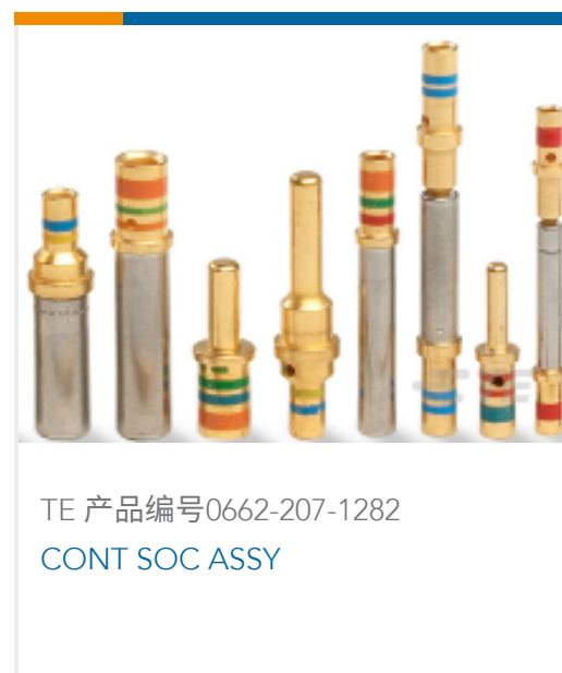
TE 产品编号 0662-207-1282 CONT SOC ASSY