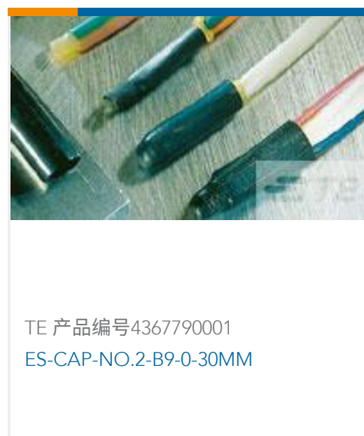
TE 产品编号 4367790001 ES-CAP-NO.2-B9-0-30MM