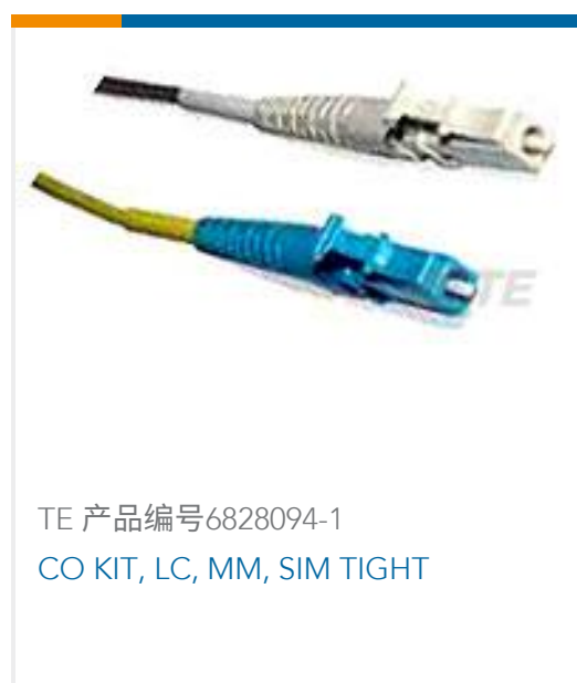
TE 产品编号 6828094-1 CO KIT, LC, MM, SIM TIGHT