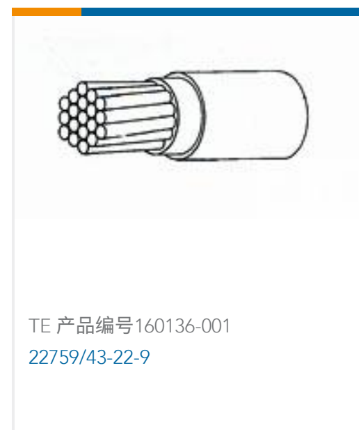
TE 产品编号 160136-001 22759/43-22-9