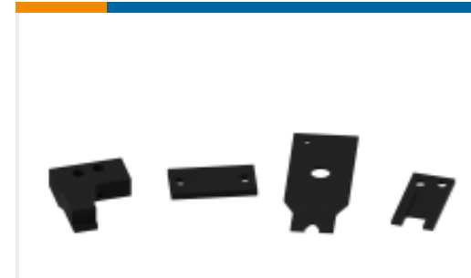
TE 产品编号1707603-8 BLADE, SLUG