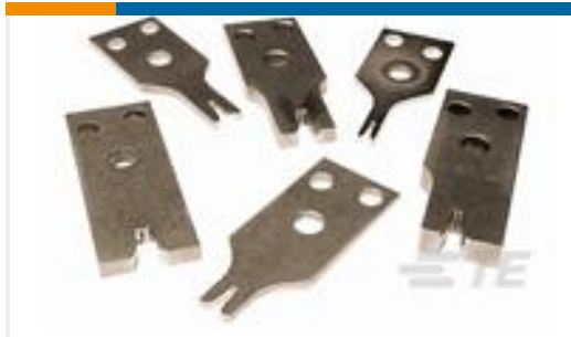
TE 产品编号1-1707601-3 CRIMPER, AMPLIVAR SPLICE