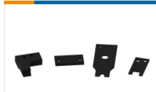
TE 产品编号1707603-7 BLADE SLUG