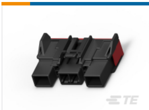
TE 产品编号1823347-1 8POS, MIXED,REC HSG,ASSY