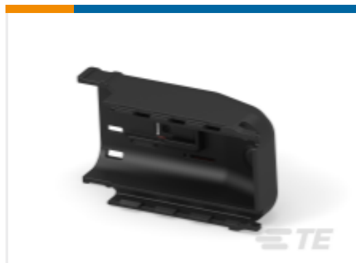
TE 产品编号2299988-1 65W PLUG COVER AND CPA ASSEMBLY