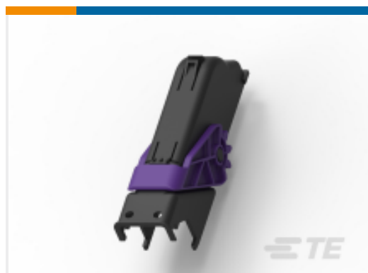
TE 产品编号2141411-1 COVER,32POSN., REC HSG,ASSY