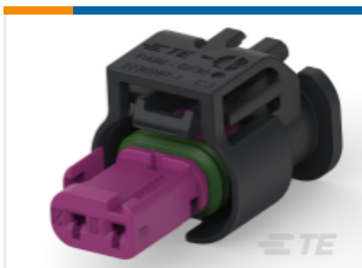
TE 产品编号4-2236896-1 2POS, MCON 1.2 LL REC SEALED