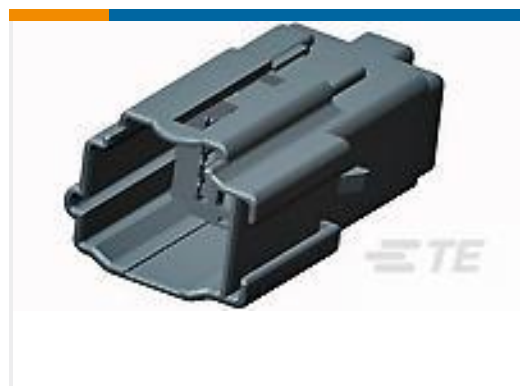
TE 产品编号2141994-1 10POS,TAB 0.63X0.64,PIN HSG,ASSY