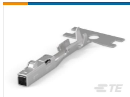
TE 产品编号2296537-1 MONO MCON1.2 REC TERMINAL