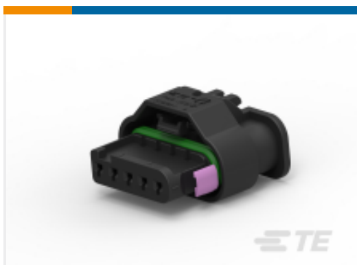
TE 产品编号1-2236898-1 5POS, MCON 1.2 LL REC SEALED