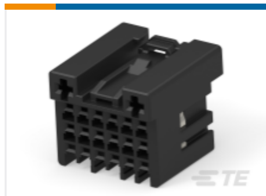
TE 产品编号2298671-1 20POS,HYBRID,REC HSG ASSY, UNSLD,COD A