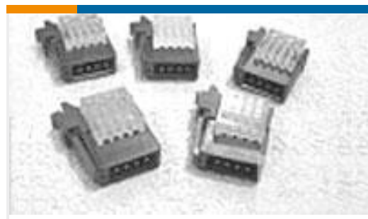
TE 产品编号1473562-6 RITS CONN. PLUG ASSY 6P YELLOW