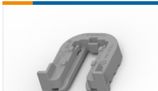
TE 产品编号1703838-6 SLIDE,TAB HSG GROUP A