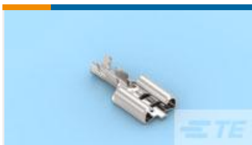
TE 产品编号444156-4 .250 FASTON REC.