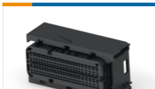
TE 产品编号8-1564284-5 96POS,MCON-1.2 CB,REC HSG,ASSY