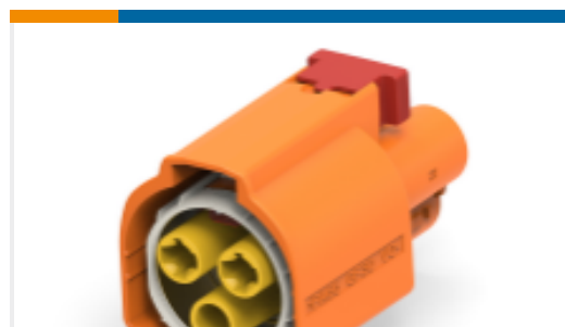
TE 产品编号2-2371035-1 PIN CONN CVR,3POS,DIA 4MM,CVE BLIND PLUG