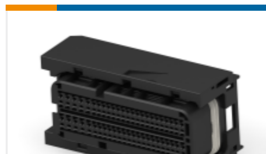
TE 产品编号2359941-6 96POS,MCON-1.2 CB,REC HSG,ASSY