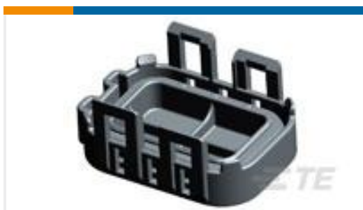
TE 产品编号1394052-1 VERSCHL-KAP21P,DICH