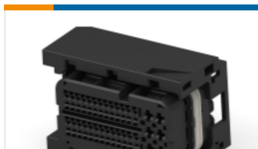
TE 产品编号2-2289748-0 58POS, MIXED,REC HSG,ASSY