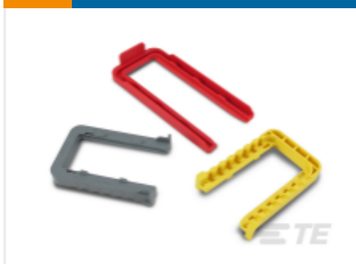
TE 产品编号2112166-2 LEAVYSEAL Locking Slides