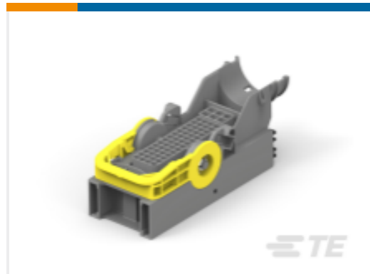
TE 产品编号2-2293551-1 62POS, MIXED, REC HSG, ASSY, SLD