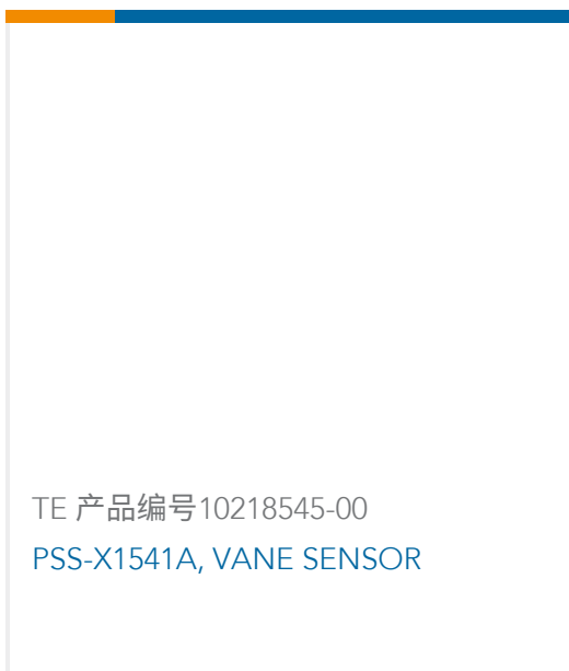
TE 产品编号10218545-00 PSS-X1541A, VANE SENSOR