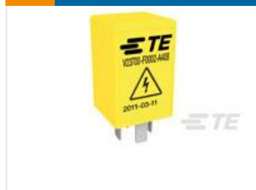
TE 产品编号2-1904058-7 V23700F0002A408-EV-CBOX