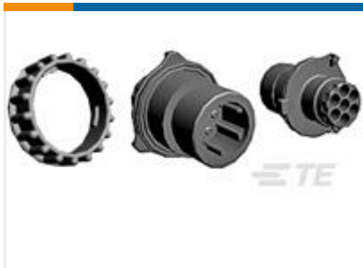
TE 产品编号1544676-1 1.5 MM PIN HSG 7W SEALED