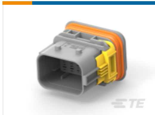
TE 产品编号2-1823449-1 22POS, MIXED, TAB HSG, ASSY