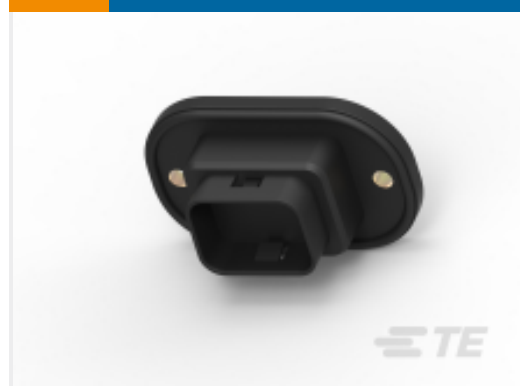
TE 产品编号1823444-1 ADAPTER, FOR A-PILLAR, ASSY