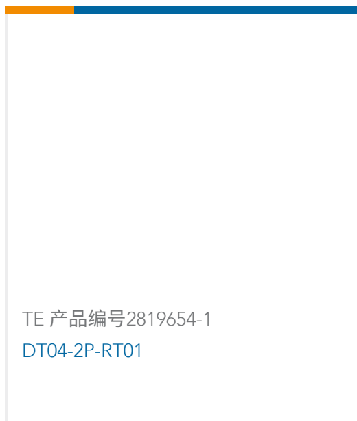
TE 产品编号2819654-1 DT04-2P-RT01