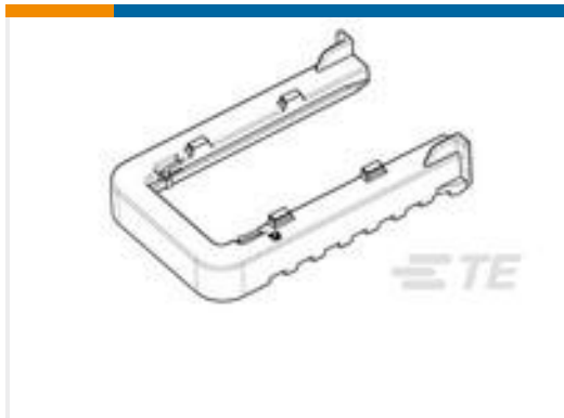
TE 产品编号2112166-2 SLIDE, FOR 21POS.