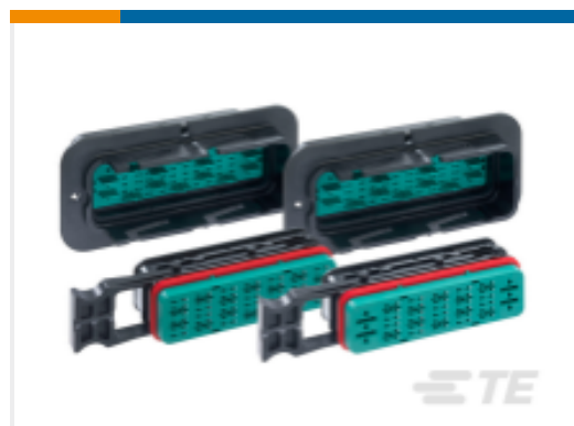
TE 产品编号2500005-1 SRC Pwr 60+6AG Female Recp Hsg Assy