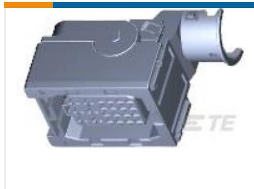
TE 产品编号1-1823440-3 22POS, MIXED, REC HSG, ASSY, SEALED