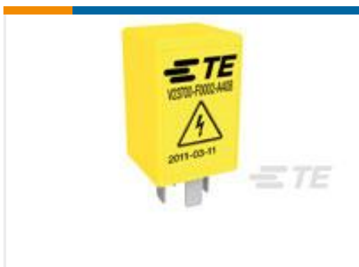
TE 产品编号2-1904058-7 V23700F0002A408-EV-CBOX