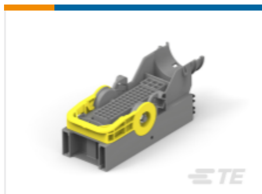
TE 产品编号2-2293551-1 62POS, MIXED, REC HSG, ASSY, SLD