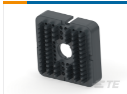
TE 产品编号WB-60PB WEDGE LOCK, 60P, REC, BLK, DRB, B