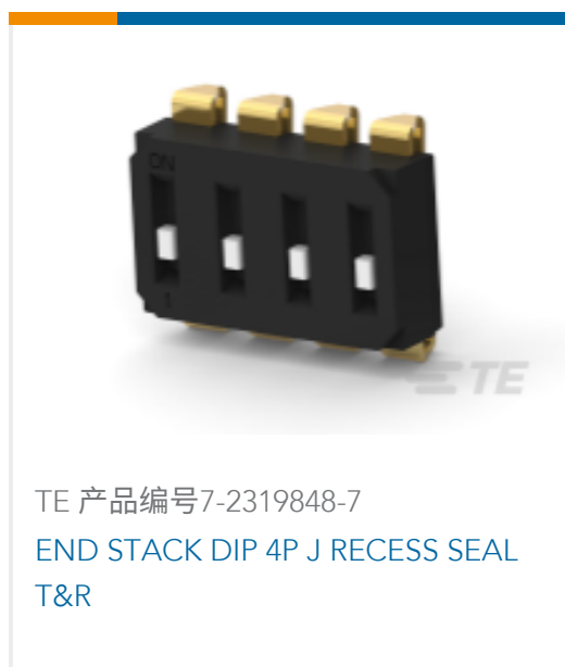
TE 产品编号7-2319848-7 END STACK DIP 4P J RECESS SEAL T&R