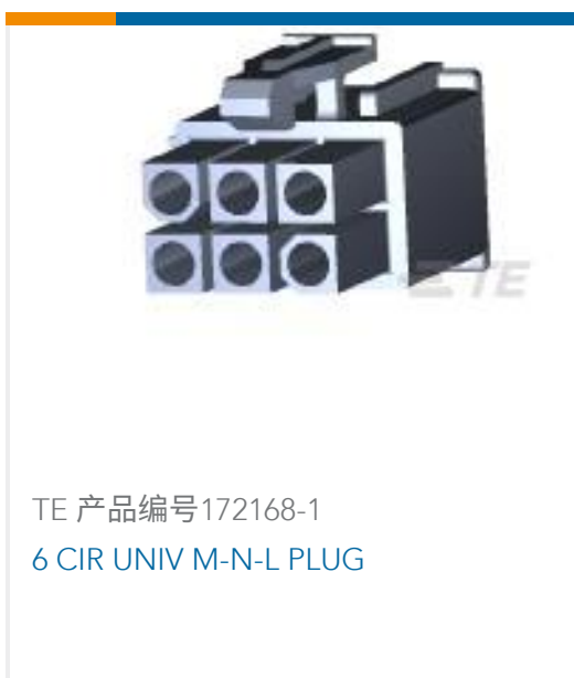
TE 产品编号172168-1 6 CIR UNIV M-N-L PLUG