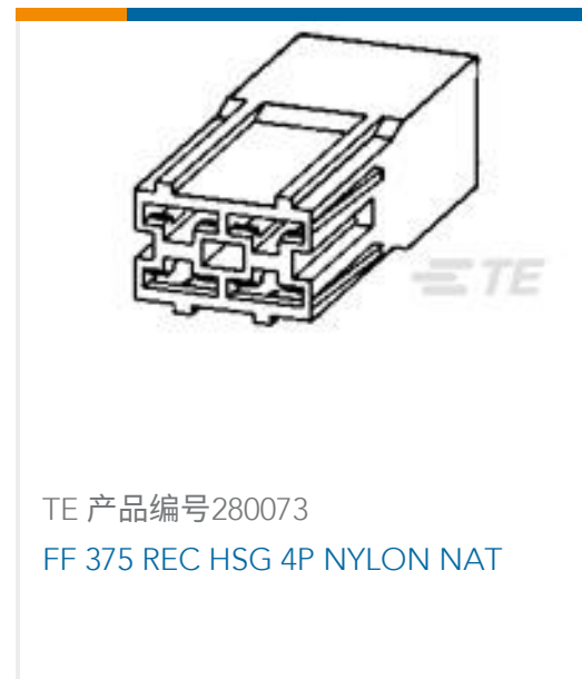
TE 产品编号280073 FF 375 REC HSG 4P NYLON NAT