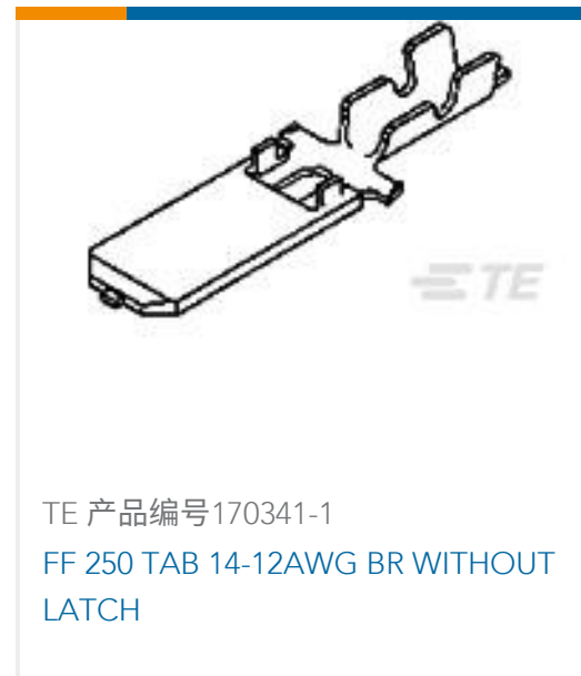
TE 产品编号170341-1 FF 250 TAB 14-12AWG BR WITHOUT LATCH