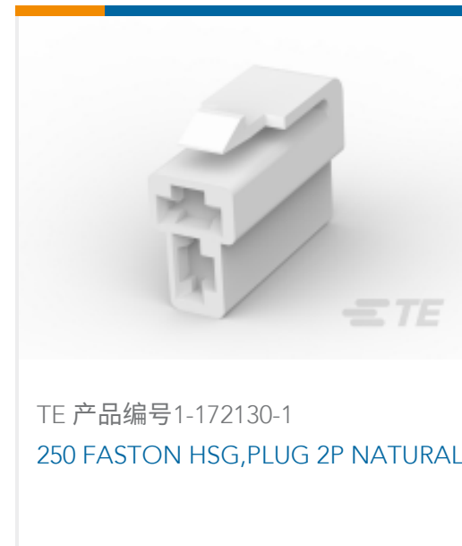
TE 产品编号1-172130-1 250 FASTON HSG, PLUG 2P NATURAL