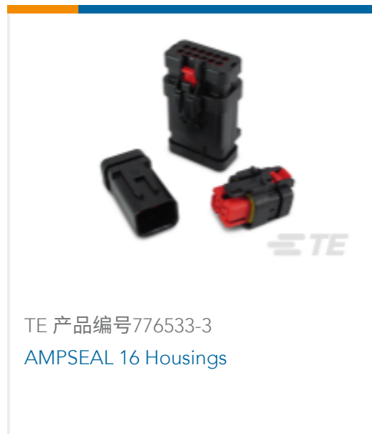
TE 产品编号776533-3 AMPSEAL 16 Housings