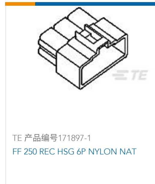
TE 产品编号171897-1 FF 250 REC HSG 6P NYLON NAT