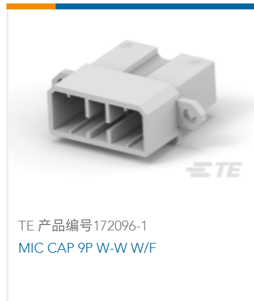
TE 产品编号172096-1 MIC CAP 9P W-W W/F