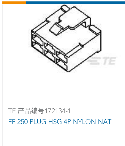
TE 产品编号172134-1 FF 250 PLUG HSG 4P NYLON NAT