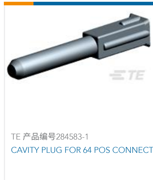
TE 产品编号284583-1 CAVITY PLUG FOR 64 POS CONNECT