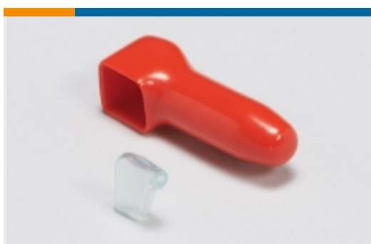
绝缘防护罩和套管(4)