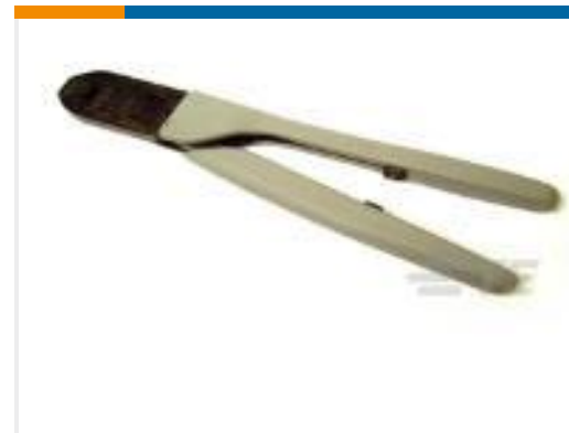
TE 产品编号 91591-1 CCII DRAWER CONNECTOR 24-20 ASSY