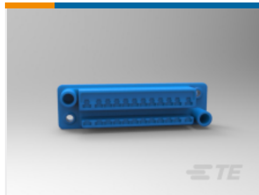
TE 产品编号 CAT-AM7017-SD292P Standard Drawer Plug Housings