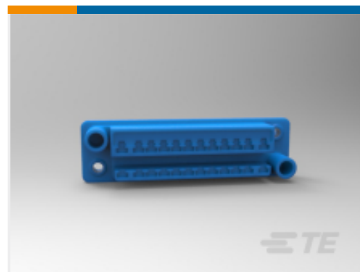
TE 产品编号5172068-3 Standard Drawer Receptacle Housings