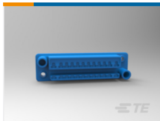
TE 产品编号172061-3 Standard Drawer Plug Housings