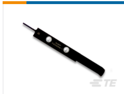
TE 产品编号 723986-1 EXTRACTION TOOL