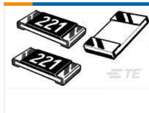
TE 产品编号4-1622820-5 3520 3R3 5%