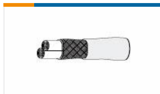
TE 产品编号123421-000 55A1122-20-9/96-9CS2275