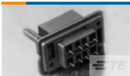
TE 产品编号5172625-3 DRAWER CONN. FEMALE ASSY 24P