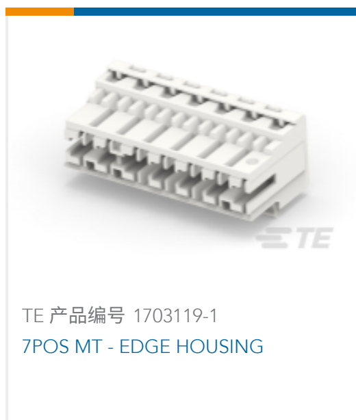
TE 产品编号 1703119-1 7POS MT - EDGE HOUSING