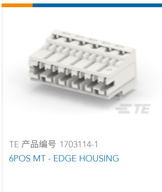
TE 产品编号 1703114-1 6POS MT - EDGE HOUSING