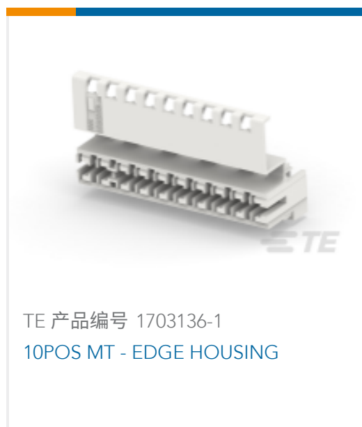
TE 产品编号 1703136-1 10POS MT - EDGE HOUSING