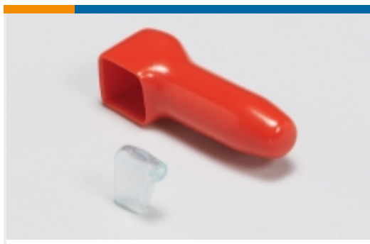
绝缘防护罩和套管(4)