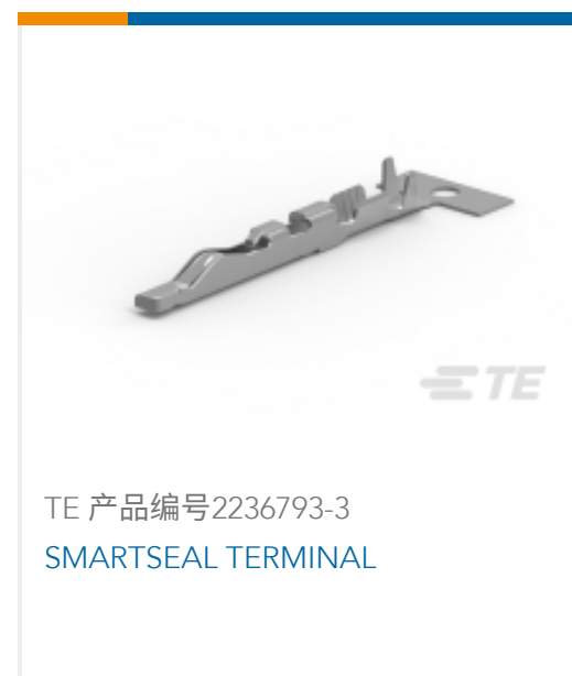
TE 产品编号2236793-3 SMARTSEAL TERMINAL