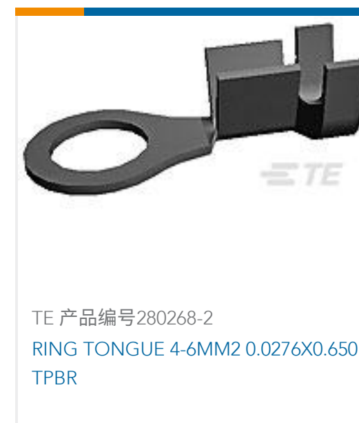
TE 产品编号280268-2 RING TONGUE 4-6MM2 0.0276X0.650 TPBR