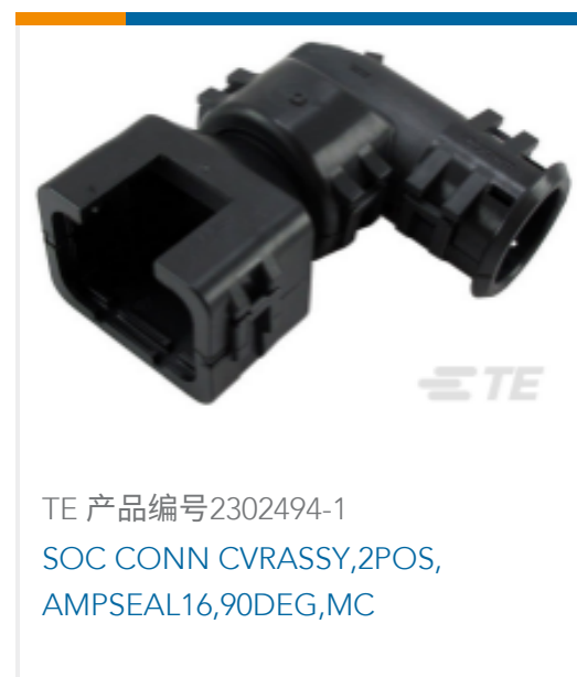
TE 产品编号2302494-1 SOC CONN CVRASSY, 2POS, AMPSEAL16, 90DEG, MC