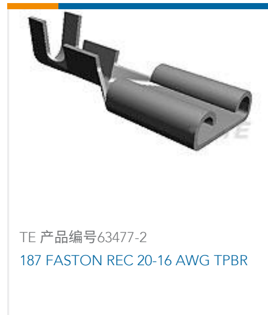
TE 产品编号63477-2 187 FASTON REC 20-16 AWG TPBR