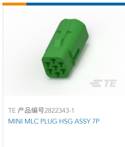
TE 产品编号2822343-1 MINI MLC PLUG HSG ASSY 7P