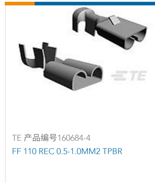
TE 产品编号160684-4 FF 110 REC 0.5-1.0MM2 TPBR