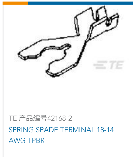
TE 产品编号42168-2 SPRING SPADE TERMINAL 18-14 AWG TPBR