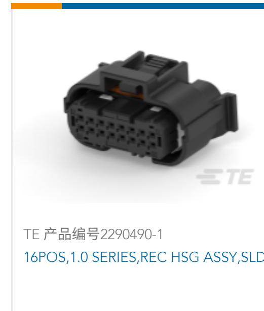
TE 产品编号2290490-1 16POS, 1.0 SERIES, REC HSG ASSY, SLD