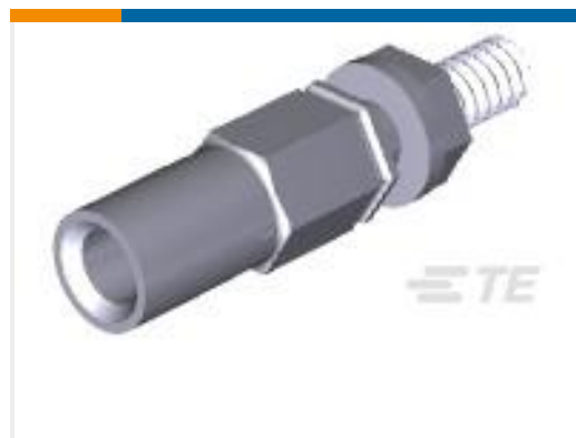
TE 产品编号170987-1 FEMALE JACKSCREW AS