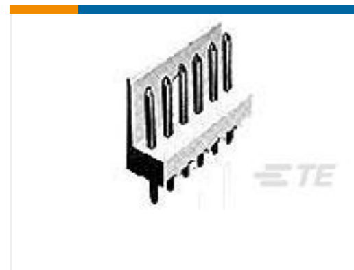
TE 产品编号173081-6 6P EIS POST HDR ASSY