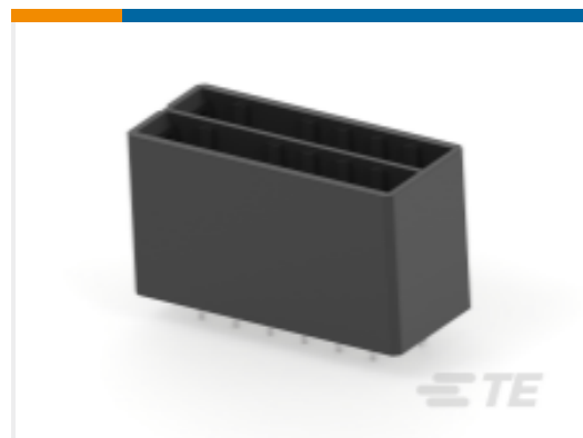
TE 产品编号2-917658-3 Header Assembly: Wire-to-Board, 15A, gold or tin plated