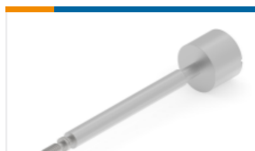
TE 产品编号170994-1 JACK SCREW MALE