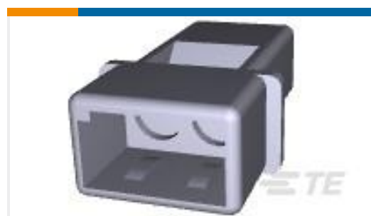
TE 产品编号170924-1 MNL 2 POS NATURAL PIN HSG