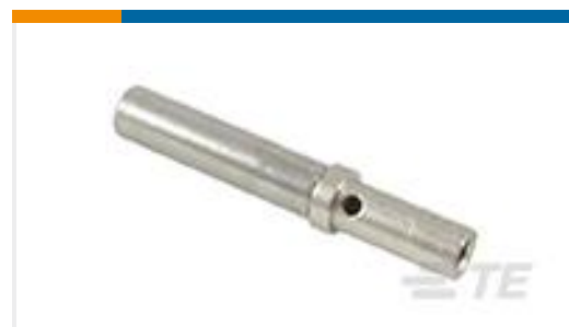
TE 产品编号0462-201-16141 SOC, SOLID, SIZE 16, 16-20AWG, NI