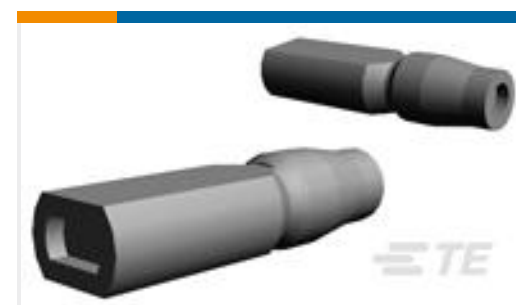
TE 产品编号170823-2 250 FASTON SLEEVE, REC., TRANSPARENT