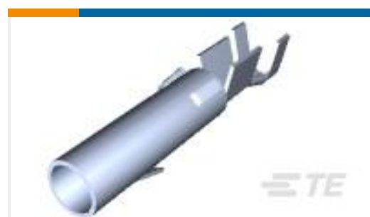
TE 产品编号170148-1 MATE-N-LOK SOC LP