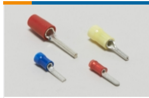
压接电线插针、公端和插针(37)