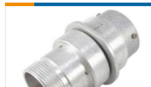
TE 产品编号HD34-24-31PT-072 REC, 31P, AL, T, THD ADPT, DRAIN, 16, P