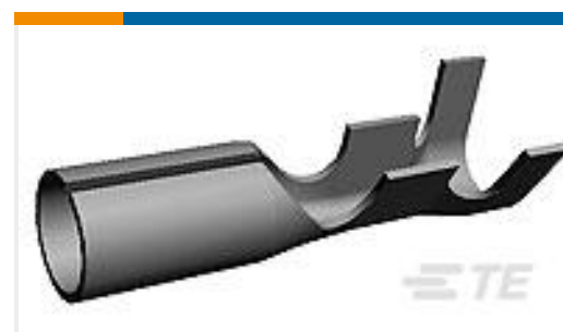
TE 产品编号170021-2 SHUR PLUG RECEPTACLE 20-16 AWG TPBR