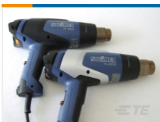
TE 产品编号 EG8162-000 HL1920E-230V-EURO