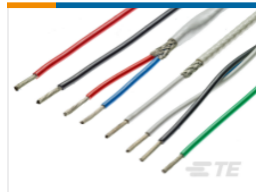
TE 产品编号CQ16123001 FLHTC0331-0.35-0/2/9