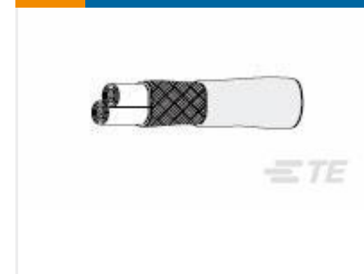
TE 产品编号3846313001 44A1121-22-5/6-9