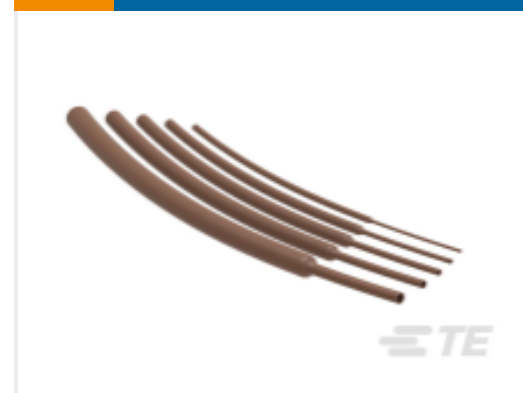
TE 产品编号5070084155 RNF-100-X 热缩管