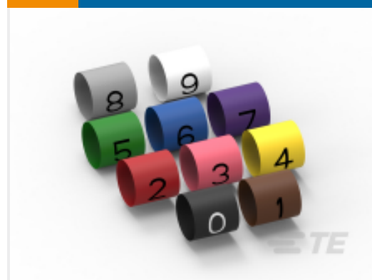
TE 产品编号7263000001 TRSA-1011/E/1/1