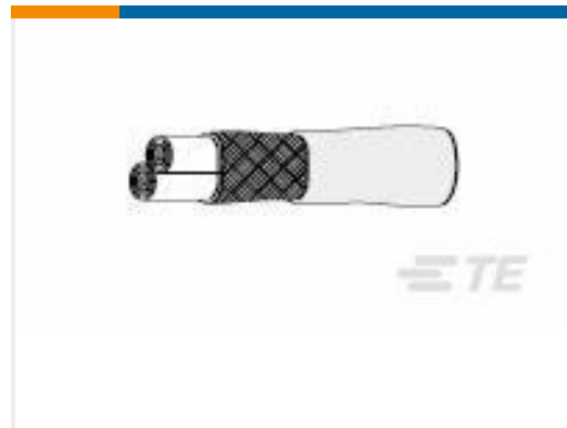
TE 产品编号3864603001 44A1121-24-5/6-9