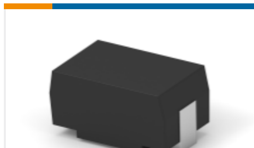
TE 产品编号1676966-1 SMD 功率电阻器：7 瓦特，200-2M 欧姆