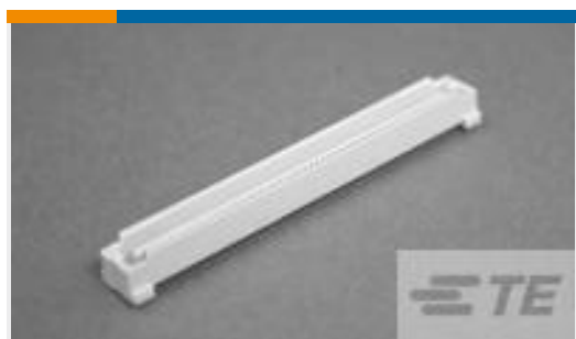
TE 产品编号5177984-1 0.8FH,P05H.5,040,08/Sn,TU