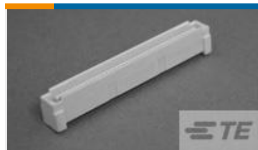
TE 产品编号3-5177986-5 0.8FH,P08H.5,120,08/Sn,TR,SC