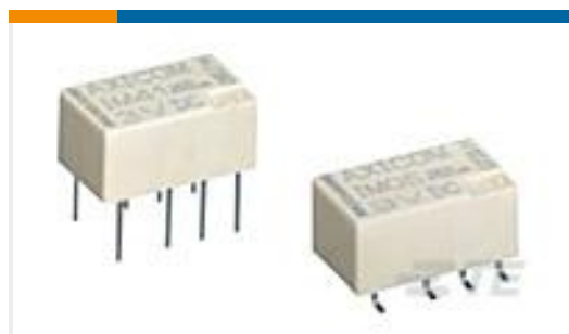
TE 产品编号1-1462037-8 IM03TS=IM RELAY 140mW 5V