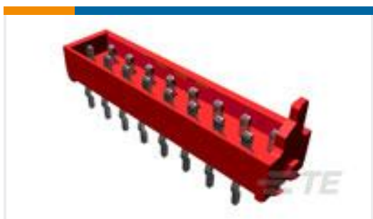
TE 产品编号7-215464-6 06P.MICRO-MATCH MOB