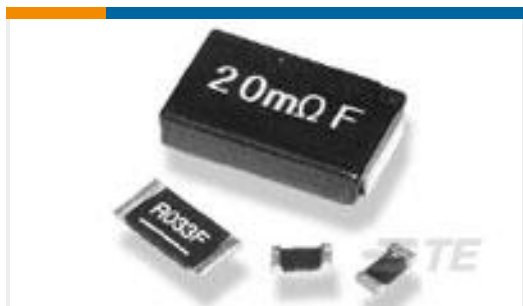
TE 产品编号3-2176157-0 TLM 2010 0.75W R047 1% 50PPM 4K RL