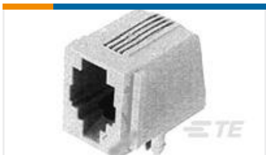
TE 产品编号5520470-3 MJ,R/A,6P/6C,TRAY PACK