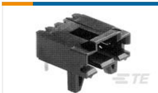
TE 产品编号5-103672-9 10 MTE HDR SRRA LATCH W/HLDWN