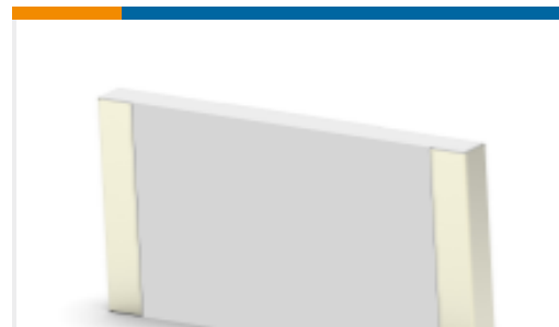
TE 产品编号2176246-8 CRGS2512 5% 3R9