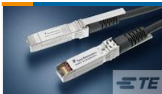
TE 产品编号2127931-1 C/A, SFP+, GENERIC, 0.5M