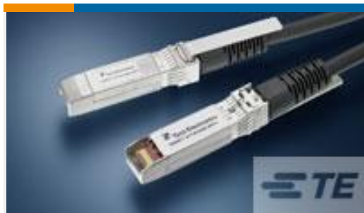
TE 产品编号2127931-1 C/A, SFP+, GENERIC, 0.5M