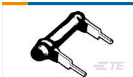
TE 产品编号1-1623714-0 FCB4 1K5 5% HP