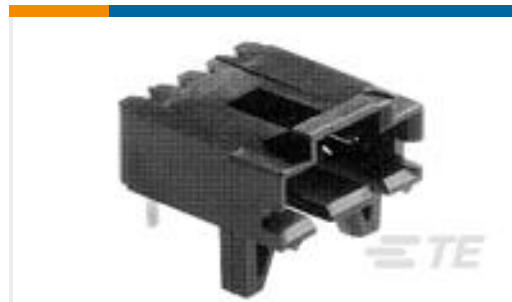
TE 产品编号5-103672-9 10 MTE HDR SRRA LATCH W/HLDWN