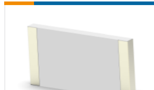
TE 产品编号2176246-8 CRGS2512 5% 3R9