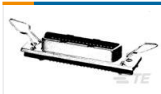
TE 产品编号5406874-1 ASSY,RCPT,50POS,SHD,LPF,V/MTG