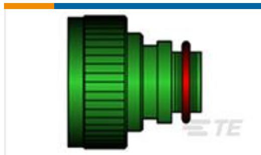
TE 产品编号734059-000 TXR40AB00-1810AI