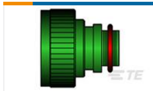
TE 产品编号106443-000 TXR40AB00-1408AI