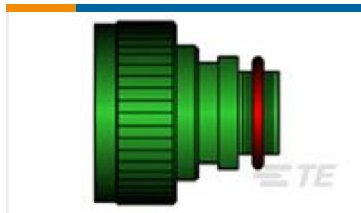
TE 产品编号293973-000 TXR40AB00-1612AI