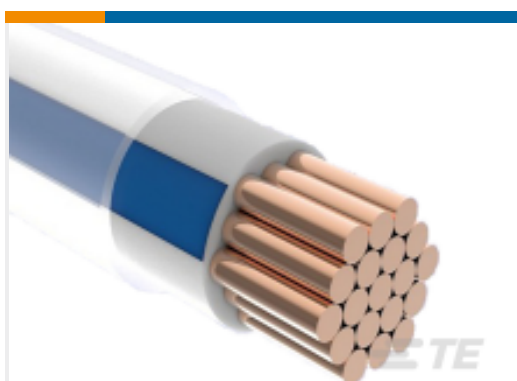
TE 产品编号CD31193001 ACW0219-0.50-73(NS)