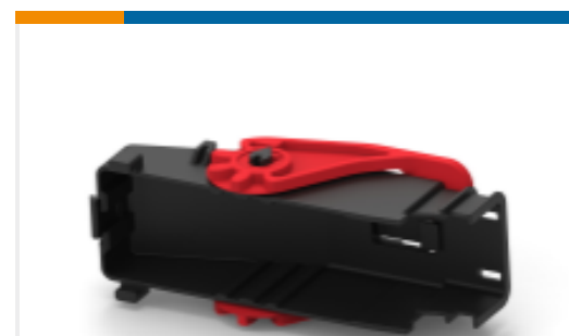
TE 产品编号2035037-1 WIRE DRESS ASSY, 96P LOW PROFI