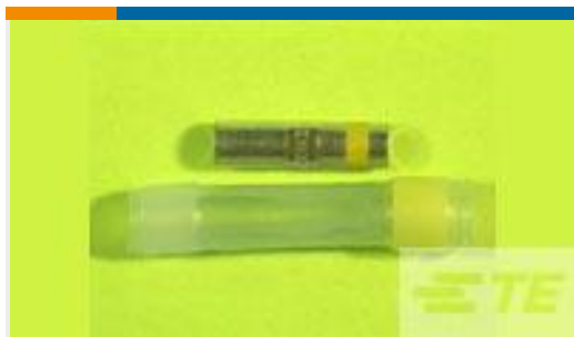
TE 产品编号 650076-000 D-436-38