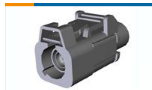
TE 产品编号776682-2 Plug Kit, RG-59, Fakra, 180 Deg, Unassem