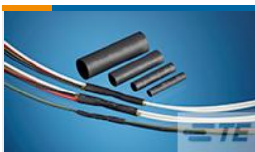
TE 产品编号2525596025 RBK-ILS-125-NR1-0-80MM