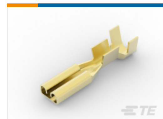
TE 产品编号170033-1 110 FASTON, REC., 16-20 AWG, BR