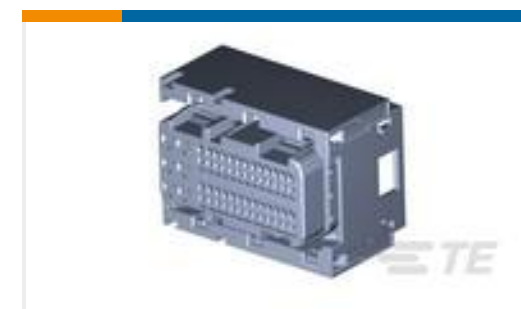
TE 产品编号9-1452415-7 58 POS MIXED, MCON CONNECTOR