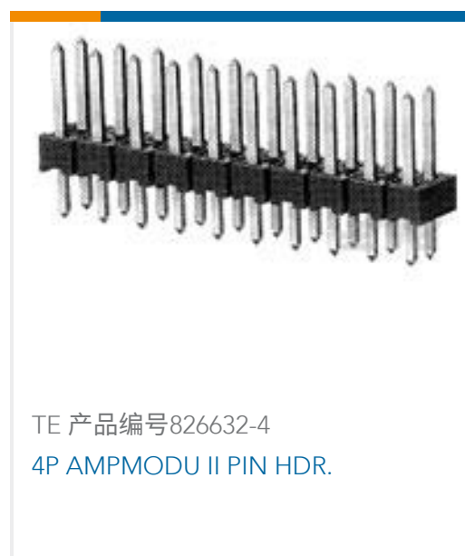
TE 产品编号826632-4 4P AMPMODU II PIN HDR.