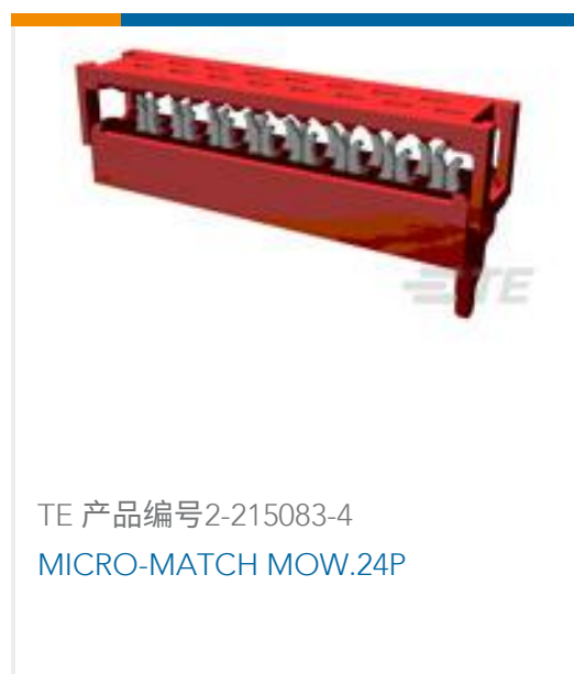
TE 产品编号2-215083-4 MICRO-MATCH MOW.24P