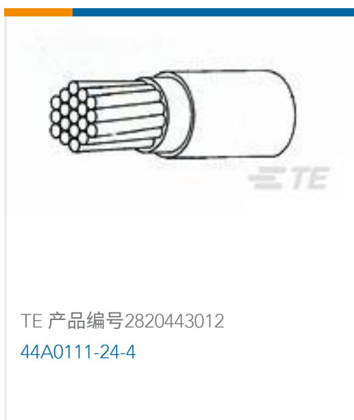
TE 产品编号2820443012 44A0111-24-4