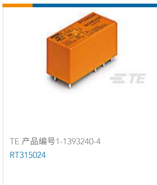
TE 产品编号1-1393240-4 RT315024