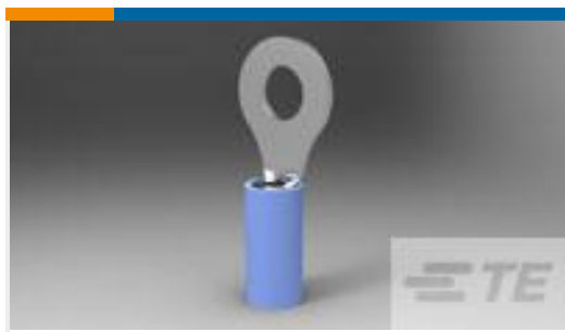
TE 产品编号2-34806-2 PIDG 16-14HD R 1/4; TAPE