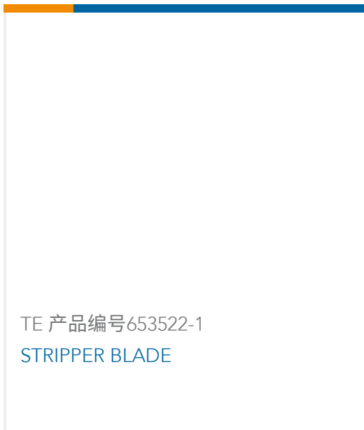
TE 产品编号653522-1 STRIPPER BLADE