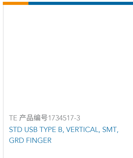
TE 产品编号1734517-3 STD USB TYPE B, VERTICAL, SMT, GRD FINGER