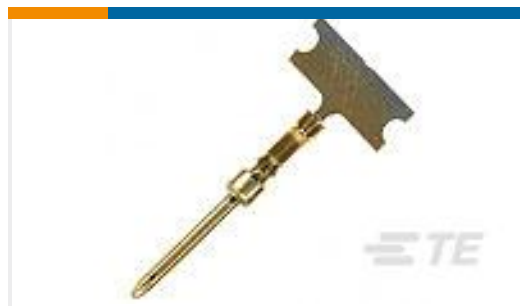
TE 产品编号166053-1 COSI PIN CONTACT HD20 DF; 24-20 AWG