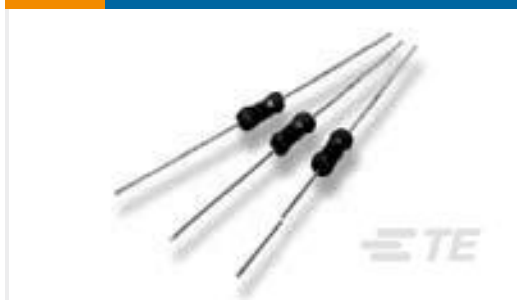
TE 产品编号1-1879355-3 RR03 5% 13K AMMO