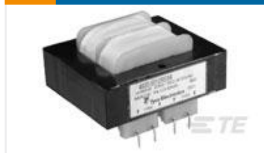
TE 产品编号1-1672326-0 4900-8048RE64=TRANSFORMER