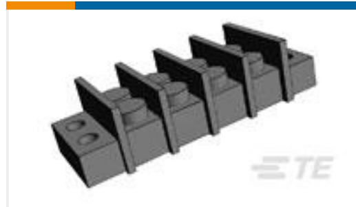
TE 产品编号1546306-4 4P .374" DR BARRIER STRIP