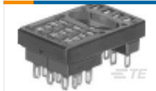
TE 产品编号1-1393143-2 27E129=SOCKET,R10,16,PC,PHEN