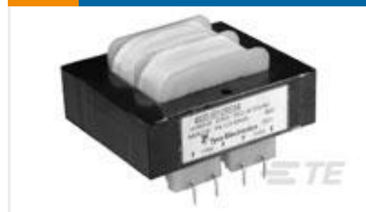
TE 产品编号1-1672326-9 4900-9028RE64=TRANSFORMER