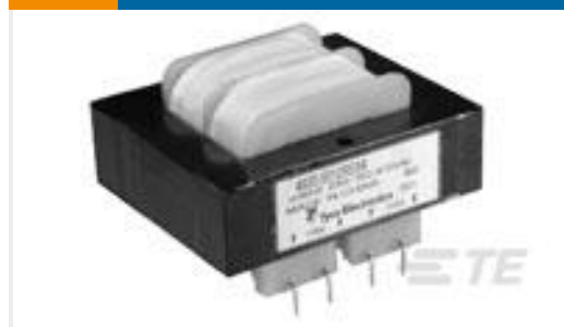
TE 产品编号1672326-6 4900-8024RE64=TRANSFORMER