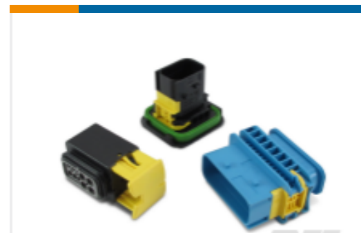
TE 产品编号1-1670214-1 重载密封系列连接器塑壳