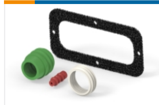
连接器密封件和盲堵(5)