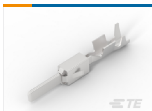
TE 产品编号1-963746-2 SPECIAL TERMINAL 17-13 AWG SLIPBR LP