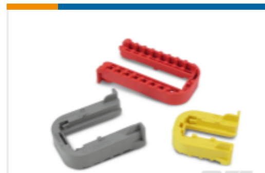
TE 产品编号1670720-1 重载密封系列连接器固定夹