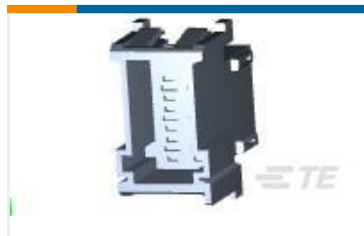
TE 产品编号3-965641-1 TAB HSG 2.8MM 6POS.