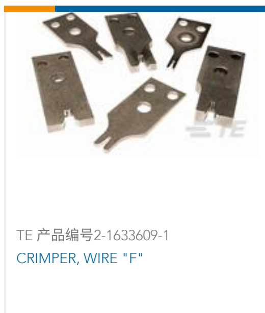
TE 产品编号2-1633609-1 CRIMPER, WIRE "F"