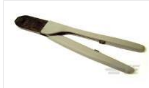
TE 产品编号91517-1 CCII FEMALE MOD IV REC 24-22 ASSY