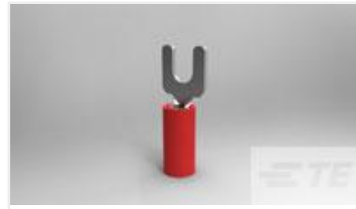
TE 产品编号34080 PIDG SPD 22-16 COMM 22-18MIL 6