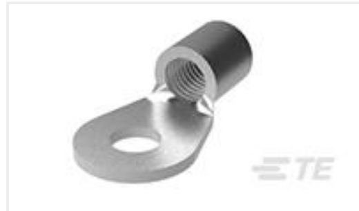
TE 产品编号31812 TERMINAL,SOLIS R 4 3/8