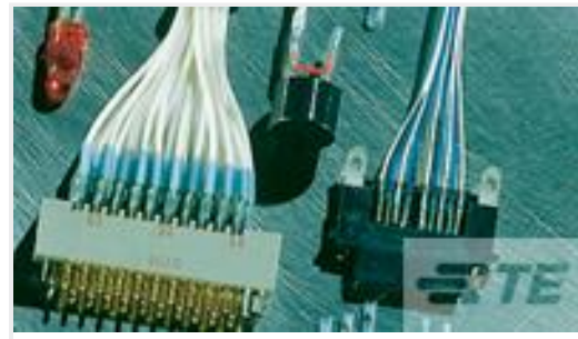
TE 产品编号625256-000 D-110-0062