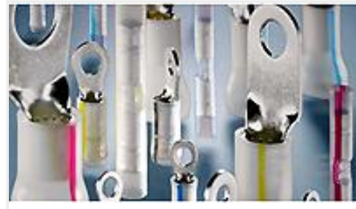
TE 产品编号53407-1 PIDG PVF2 R 22-16COM22-18MIL 6