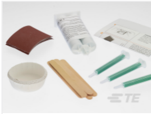
TE 产品编号657863-000 S1125-KIT-8