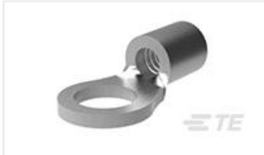
TE 产品编号34119 TERMINAL,SOLIS R 16-14 4