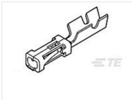
TE 产品编号103455-2 MOD V RECP LP