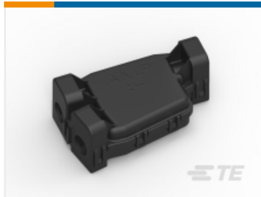
TE 产品编号444423-2 PROTECTIVE COVER ASSY