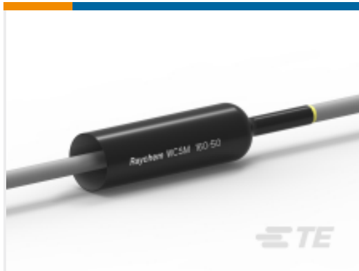
TE 产品编号EE0474-000 厚壁热缩管