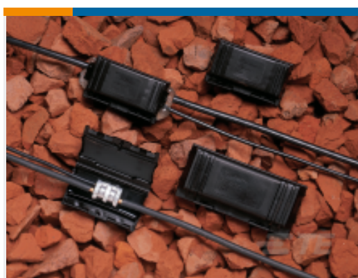
TE 产品编号 348333-000 GHFC-2-90(B100)