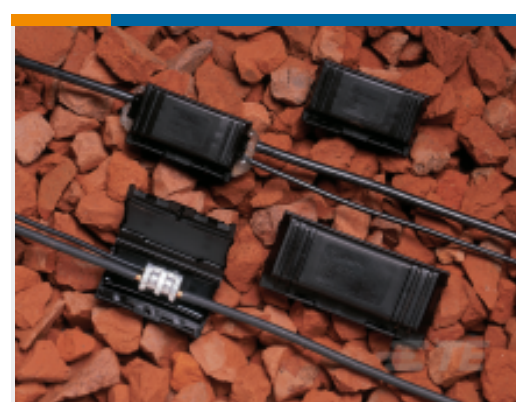
TE 产品编号 C48562-000 GHFC-2.5-90(B300)