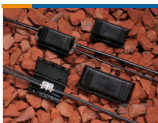
TE 产品编号 294925-000 GHFC-2-90(B10)