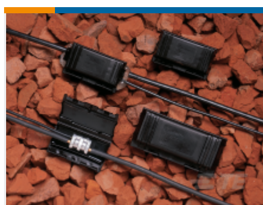
TE 产品编号 765669-000 GHFC-1-90(B10)