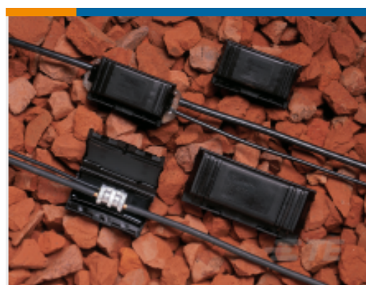
TE 产品编号 505941-000 GHFC-3-90(B6)