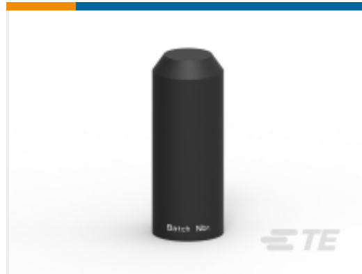
TE 产品编号160021N001 102L044/S(S50)