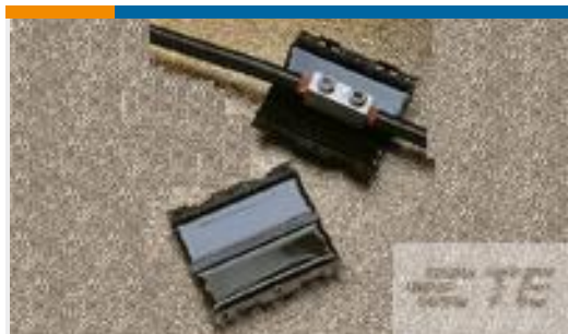
TE 产品编号914517-000 GILS-4/0(B72)