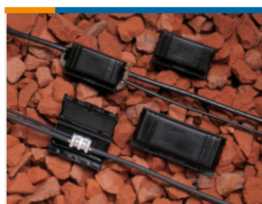
TE 产品编号 629995-000 GHFC-3-90(B18)