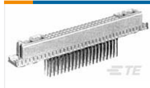
TE 产品编号5148420-5 ASSY,RECPT,TYPE M,EUROCARD,L-F