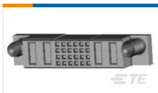
TE 产品编号6450140-5 MBXL VERT RCPT 2P+24S+2P