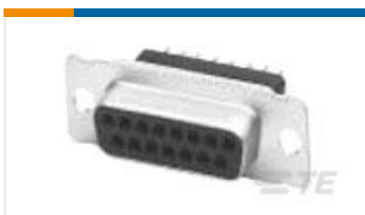
TE 产品编号5745886-3 HD-20 RCPT 25P VERT FULL METAL SHELL