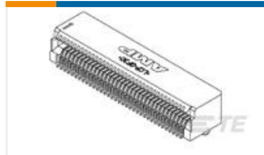
TE 产品编号1367337-2 70 POS PT CONNECTOR, X2, XENPAK, 30 AU