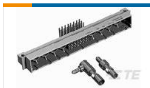
TE 产品编号5148412-5 ASSY,PIN,R.A.,TYPE M,EUROCARD,L-FREE,60+