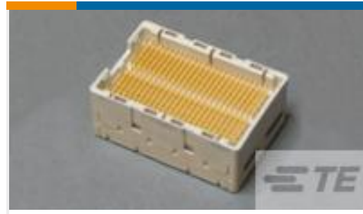
TE 产品编号6-1761614-5 STEP-Z PLUG 15MM 200P LF ST