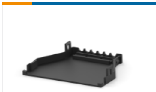
TE 产品编号1776695-1 Strain Relief, D5200, Dynamic