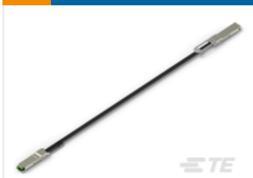
TE 产品编号2333393-7 QSFP 25GIG 30AWG 3 METER