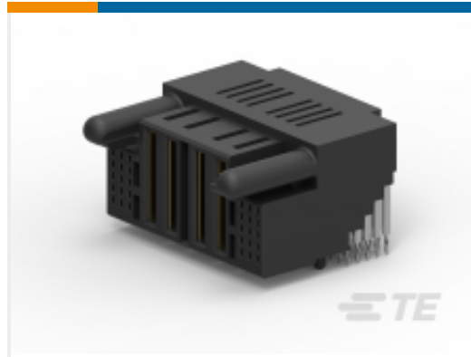
TE 产品编号2204400-1 MULTI-BEAM HD R/A REC. 15S+2P+2P+15S