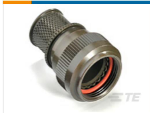
TE 产品编号BTH1-15-07-4-J BTH1-15-07-4-J