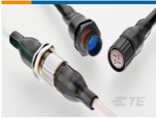
TE 产品编号2102353-6 CeeLok FAS-T, Plug Kit, ZnNi, B