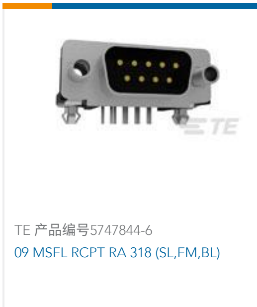
TE 产品编号5747844-6 09 MSFL RCPT RA 318 (SL,FM,BL)