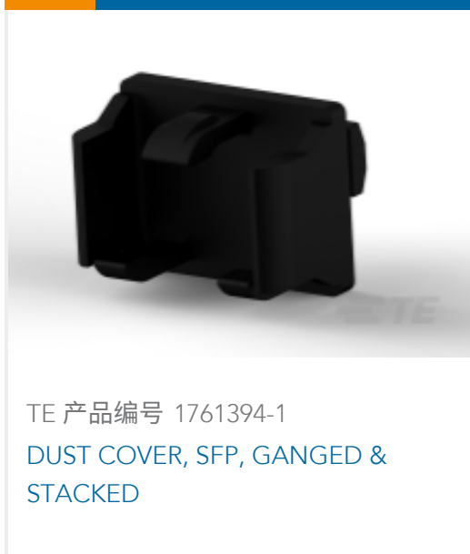
TE 产品编号 1761394-1 DUST COVER, SFP, GANGED & STACKED