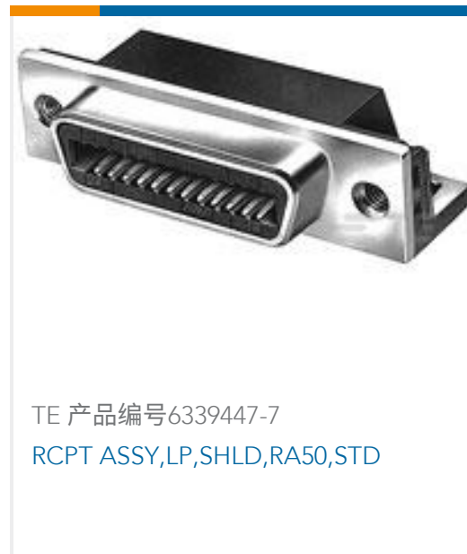
TE 产品编号6339447-7 RCPT ASSY,LP,SHLD,RA50,STD