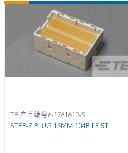
TE 产品编号6-1761612-5 STEP-Z PLUG 15MM 104P LF ST