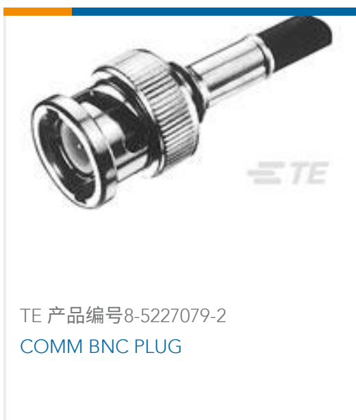
TE 产品编号8-5227079-2 COMM BNC PLUG