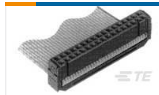
TE 产品编号 1658623-1 10 NOVO MIL 30DP, LEAD FREE