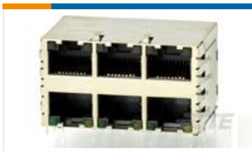
TE 产品编号 5569256-1 STK MJ ASSY, 8 POS, 2X3, SHLD, CAT5