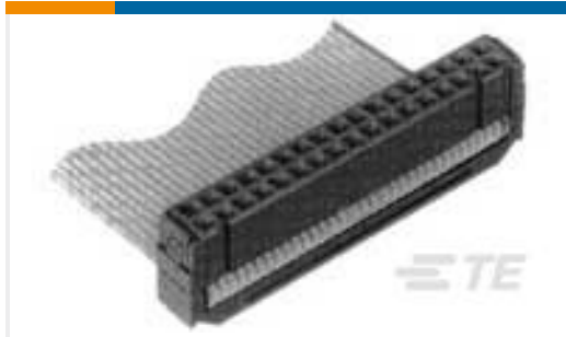
TE 产品编号 1658623-3 16 NOVO MIL 30DP, LEAD FREE