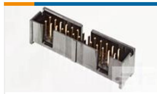
TE 产品编号 3-1761603-0 IDC LOW PRO HDR 30P VERT BLUE