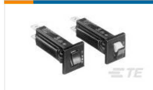
TE 产品编号 2-1393250-3 W28-XQ1A-1=W28-