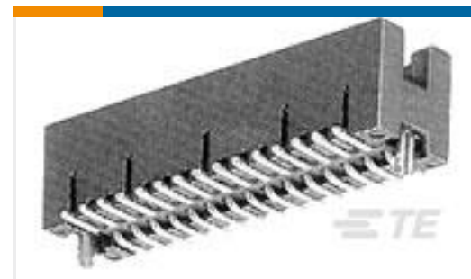
TE 产品编号 5-104655-3 20 50/50 HDR DRST SFMNT TIN