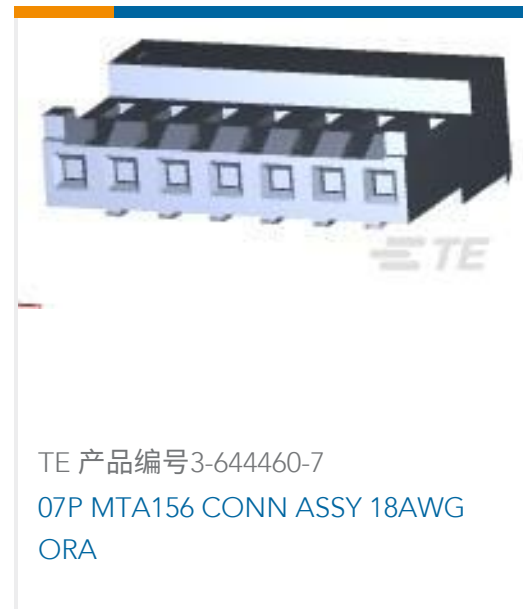
TE 产品编号3-644460-7 07P MTA156 CONN ASSY 18AWG ORA