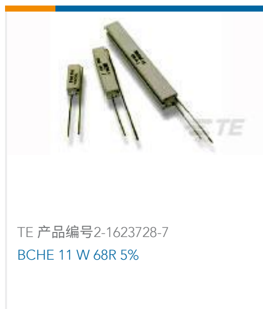
TE 产品编号2-1623728-7 BCHE 11 W 68R 5%