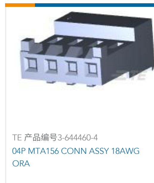
TE 产品编号3-644460-4 04P MTA156 CONN ASSY 18AWG ORA