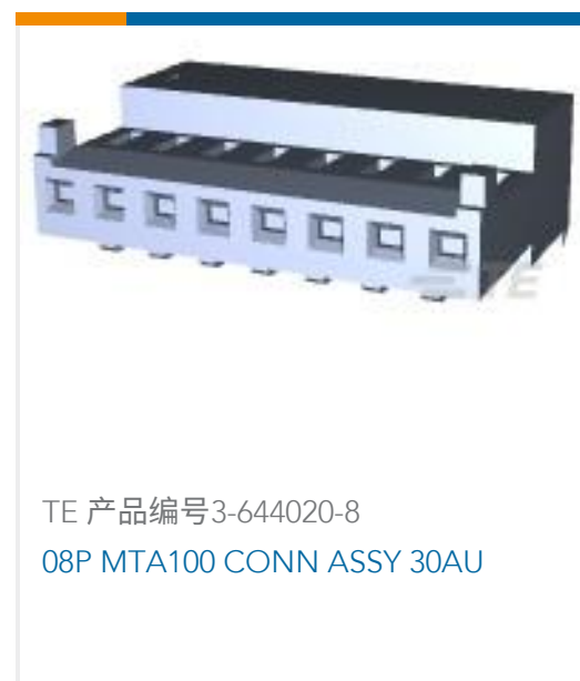
TE 产品编号3-644020-8 08P MTA100 CONN ASSY 30AU