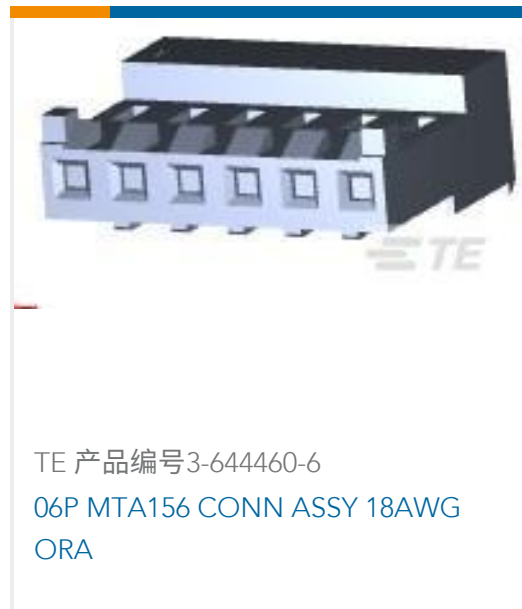
TE 产品编号3-644460-6 06P MTA156 CONN ASSY 18AWG ORA