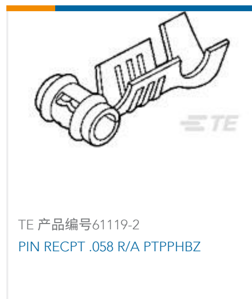
TE 产品编号61119-2 PIN RECPT .058 R/A PTPPHBZ