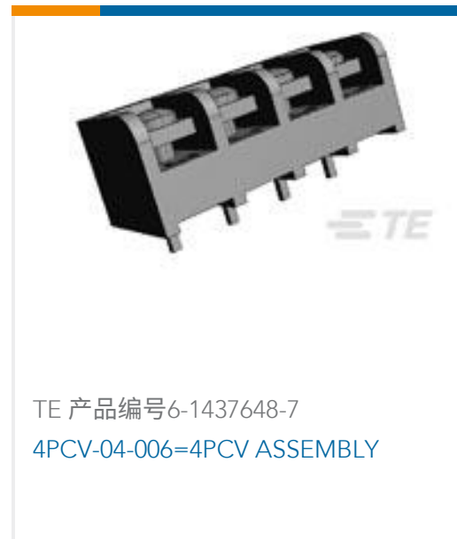
TE 产品编号6-1437648-7 4PCV-04-006=4PCV ASSEMBLY